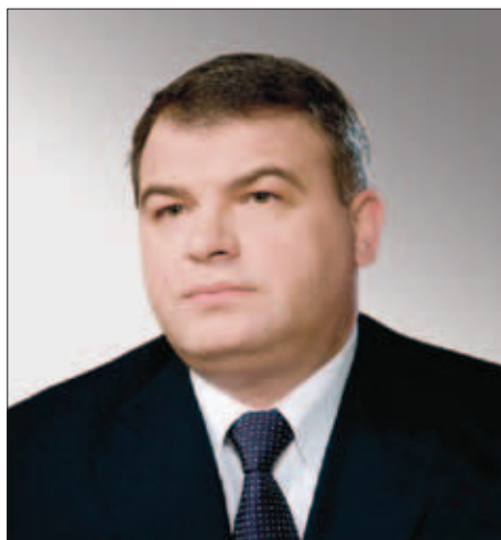
Анатолий Эдуардович Сердюков МИНИСТР ОБОРОНЫ РОССИЙСКОЙ ФЕДЕРАЦИИ

Система военного образования является инструментом формирования кадрового потенциала Вооруженных Сил РФ. Сегодня она играет ведущую роль в обучении, профессиональной переподготовке и повышении квалификации военнослужащих, воспроизводстве педагогических и научных кадров. Ее значимость должна сохраниться и в будущем. Именно поэтому повышение эффективности системы военного образования Военной доктриной Российской Федерации отнесено к основным приоритетам развития военной организации государства.