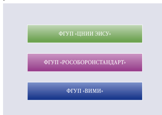
ПОДВЕДОМСТВЕННЫЕ НАУЧНО-ИССЛЕДОВАТЕЛЬСКИЕ ОРГАНИЗАЦИИ

мет ее соответствия основным показателям и направлениям расходов государственного оборонного заказа;