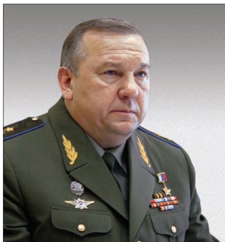
Владимир Анатольевич Шаманов КОМАНДУЮЩИЙ ВОЗДУШНО-ДЕСАНТНЫМИ ВОЙСКАМИ, ГЕНЕРАЛ-ЛЕЙТЕНАНТ

Завершен 2009 учебный год. Для Воздушно-десантных войск он был сложным, напряженным и очень ответственным.