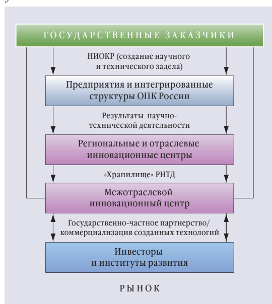
ИННОВАЦИОННАЯ ИНФРАСТРУКТУРА ОПК