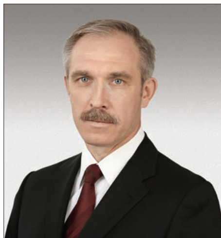
Сергей Иванович Морозов ГУБЕРНАТОР УЛЬЯНОВСКОЙ ОБЛАСТИ

Ульяновская область расположена в самом центре Среднего Поволжья, по обе стороны от р. Волги. Область входит в состав Приволжского федерального округа. Общая площадь территории составляет 37,2 тыс. кв. км (0,2% территории России). Численность населения – 1,3 млн. человек. Регион непосредственно граничит с Саратовской, Пензенской и Самарской областями, а также с республиками Мордовия, Татарстан и Чувашия.