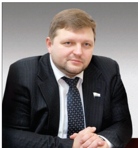
Никита Юрьевич Белых ГУБЕРНАТОР КИРОВСКОЙ ОБЛАСТИ

Оборонно-промышленный комплекс (далее – ОПК) России представляет собой многофункциональные научно-производственные отрасли промышленности, способные разрабатывать и производить современные виды и типы вооружений и военной техники, а также выпускать разнообразную наукоемкую гражданскую продукцию. Основу ОПК составляют стратегические организации, перечень которых утвержден распоряжением Правительства Российской Федерации от 20.08.2009 №1226-р. В данный перечень входит девять предприятий ОПК Кировской области.