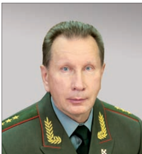
Виктор Васильевич Золотов

ПЕРВЫЙ ЗАМЕСТИТЕЛЬ МИНИСТРА ВНУТРЕННИХ ДЕЛ РОССИЙСКОЙ ФЕДЕРАЦИИ – ГЛАВНОКОМАНДУЮЩИЙ ВНУТРЕННИМИ ВОЙСКАМИ МИНИСТЕРСТВА ВНУТРЕННИХ ДЕЛ РОССИЙСКОЙ ФЕДЕРАЦИИ, ГЕНЕРАЛ-ПОЛКОВНИК