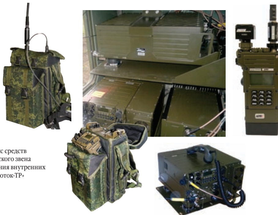
Комплекс средств тактического звена управления внутренних войск «Поток-ТР»

но-телекоммуникационная система внутренних войск (ИТКС). Применяемые при ее построении цифровые технологии формируют основу для построения современной автоматизированной системы управления внутренних войск. На сегодняшний день в контур ИТКС уже включено более 200 стационарных узлов связи пунктов управления, а к началу 2016 года планируется завершить подключение оставшихся. Благодаря ИТКС органы управления войск обеспечены такими современными услугами связи, как цифровая телефония, видео-конференц-связь, файловый обмен и др.