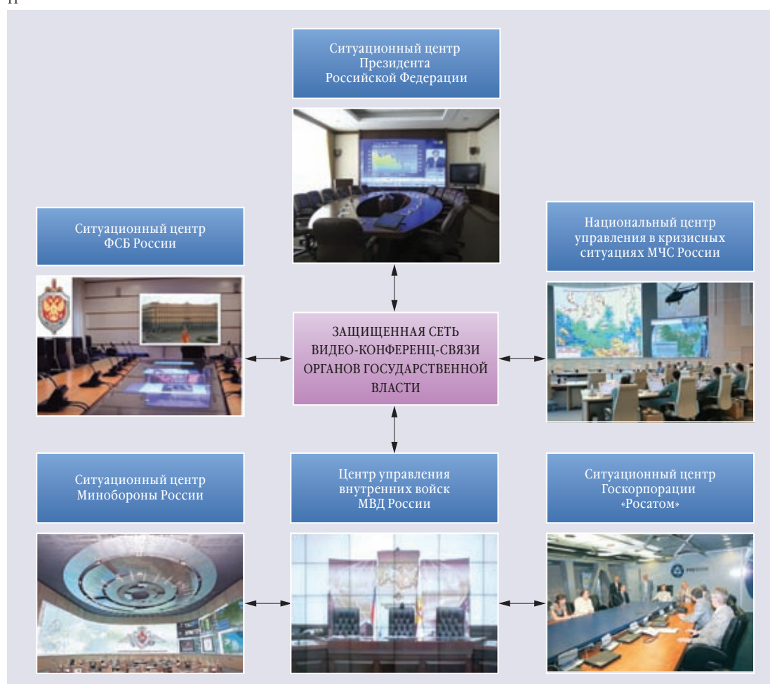
Система распределенных ситуационных центров (центр управления внутренними войсками)

Неотъемлемой составной частью строительства и развития внутренних войск является совершенствование системы управления. Интенсивное развитие средств вооруженной борьбы, изменения форм применения и способов действий войск в современных условиях, усиление напряжения в решении повседневных задач мирного времени обуславливают повышение требований к системе управления внутренних войск. В целях организации работ по ее развитию в 2010 году была утверждена Концепция развития системы управления внутренних войск Министерства внутренних дел Российской Федерации на период до 2025 года.