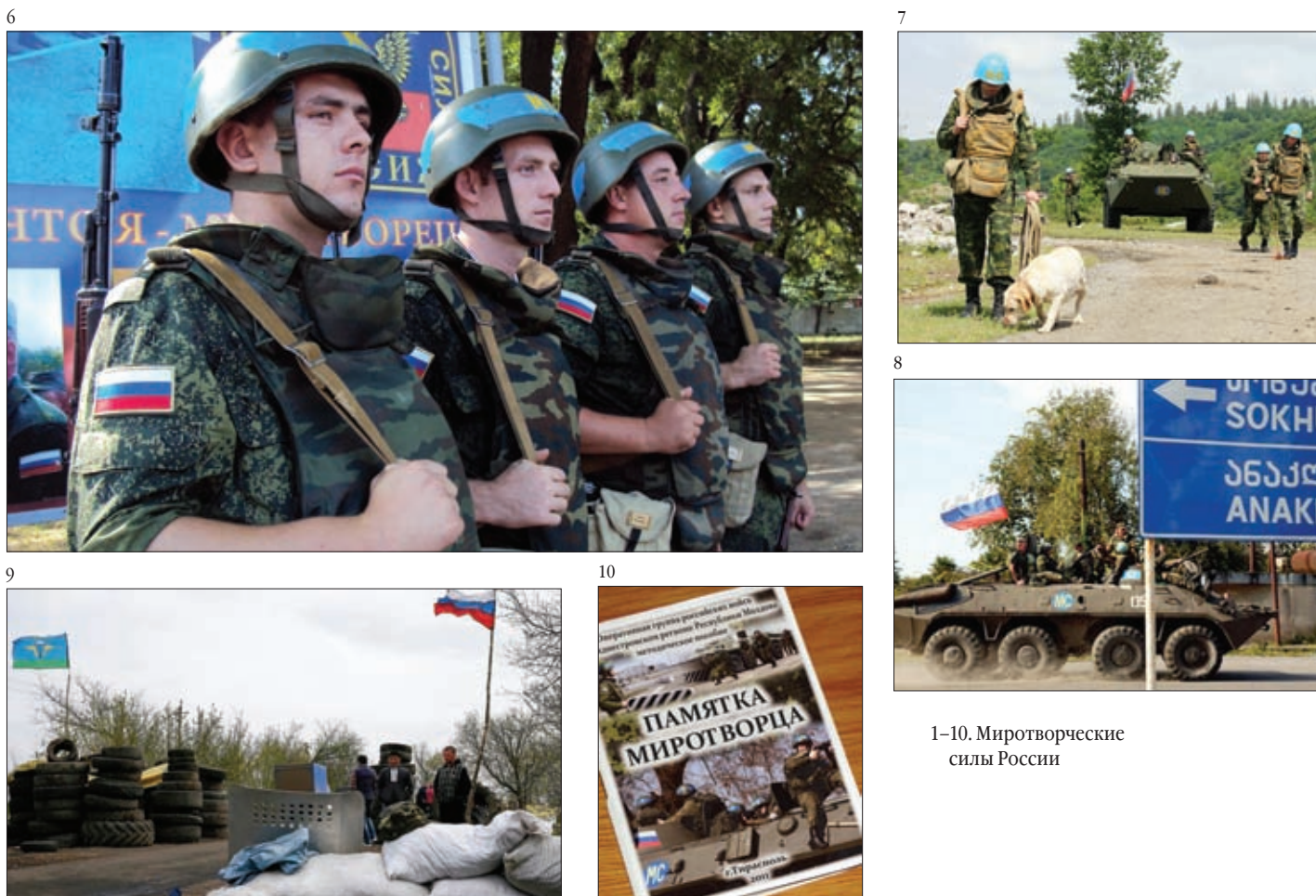
1–10. Миротворческие силы России

Россия приступила к выполнению обязательств, принятых в данном формате на 30-м саммите по укреплению миротворческого потенциала африканских стран в Си-Айленде (штат Джорджия, США) в 2004 году. Правительством Российской Федерации принято решение финансировать обучение африканских миротворцев на базе центра подготовки миротворцев ООН Всероссийского института повышения квалификации работников МВД России (до 80 человек в год до 2010 года).