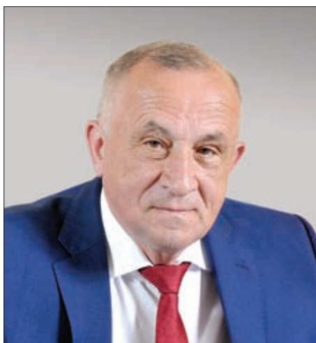
Александр Васильевич Соловьёв ГЛАВА УДМУРТСКОЙ РЕСПУБЛИКИ

В течение более чем 200 лет предприятия Удмуртии обеспечивают обороноспособность Российского государства. Начало развития отрасли в регионе положено в 1807 году, когда указом императора Александра I был создан Ижевский оружейный завод.