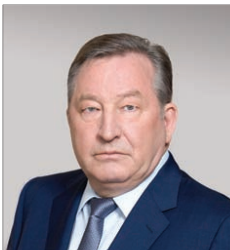
Александр Богданович Карлин ГУБЕРНАТОР АЛТАЙСКОГО КРАЯ

Становление оборонно-промышленного комплекса Алтайского края началось в годы Великой Отечественной войны, когда сюда из европейской части страны был эвакуирован ряд заводов. В 50-х годах прошлого века продолжилось создание новых производств в Барнауле, Бийске и Славгороде. Сегодня наш регион располагает значительным научным и производственным потенциалом оборонной промышленности. Наличие предприятий, выпускающих специальную продукцию, – это свидетельство высокого уровня развития промышленности Алтайского края.