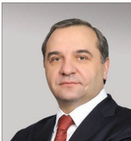
Владимир Андреевич Пучков

МИНИСТР РОССИЙСКОЙ ФЕДЕРАЦИИ ПО ДЕЛАМ ГРАЖДАНСКОЙ ОБОРОНЫ, ЧРЕЗВЫЧАЙНЫМ СИТУАЦИЯМ И ЛИКВИДАЦИИ ПОСЛЕДСТВИЙ СТИХИЙНЫХ БЕДСТВИЙ