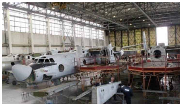
2. ОАО «308 авиационный ремонтный завод»

свой, бязевой, плательной, одежной, полотенечной, тарной, тиковой групп, а также более 100 наименований швейных изделий.