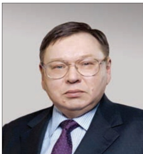
Павел Алексеевич Коньков ВРЕМЕННО ИСПОЛНЯЮЩИЙ ОБЯЗАННОСТИ ГУБЕРНАТОРА ИВАНОВСКОЙ ОБЛАСТИ

Процесс становления рыночных отношений в России predetermined глубокое противоречивые изменения в ключевых областях экономики страны. Среди многих отраслей национального хозяйства в особо сложном положении оказались предприятия оборонной промышленности.