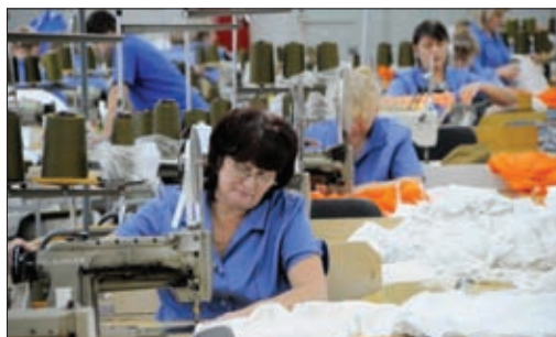
1. Изготовление продукции ОАО «Полет» Ивановского парашютного завода