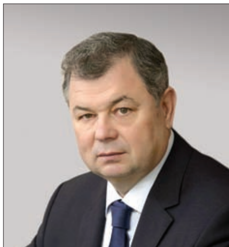
Анатолий Дмитриевич Артамонов ГУБЕРНАТОР КАЛУЖСКОЙ ОБЛАСТИ

Эффективная политика Правительства Калужской области в сфере привлечения инвестиций, масштабная модернизация экономики региона, повышение производительности труда, использование передовых технологий производства – таковы составляющие социально-экономического развития Калужского региона в последние годы.