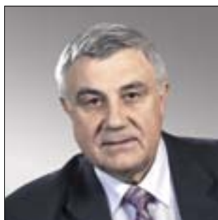
ГУБЕРНАТОР ВЛАДИМИРСКОЙ ОБЛАСТИ Николай Владимирович Виноградов