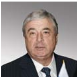
ГОСУДАРСТВЕННЫЙ СЕКРЕТАРЬ СОЮЗНОГО ГОСУДАРСТВА Павел Павлович Бородин