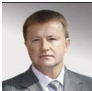
ГУБЕРНАТОР ТУЛЬСКОЙ ОБЛАСТИ Вячеслав Дмитриевич Дудка