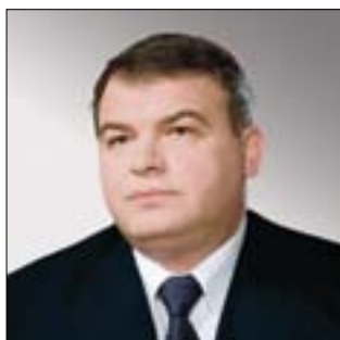
МИНИСТР ОБОРОНЫ РОССИЙСКОЙ ФЕДЕРАЦИИ Анатолий Эдуардович Сердюков