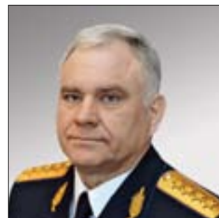
ПЕРВЫЙ ЗАМЕСТИТЕЛЬ ДИРЕКТОРА ФЕДЕРАЛЬНОЙ СЛУЖБЫ БЕЗОПАСНОСТИ РОССИЙСКОЙ ФЕДЕРАЦИИ, ДИРЕКТОР ПОГРАНИЧНОЙ СЛУЖБЫ ФСБ РОССИИ ГЕНЕРАЛ АРМИИ, ГЕРОЙ РОССИЙСКОЙ ФЕДЕРАЦИИ Владимир Егорович Пронин