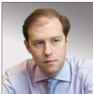
ЗАМЕСТИТЕЛЬ МИНИСТРА ПРОМЫШЛЕННОСТИ И ТОРГОВЛИ РОССИЙСКОЙ ФЕДЕРАЦИИ Денис Валентинович Мантуров