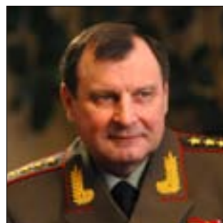
НАЧАЛЬНИК ТЫЛА ВООРУЖЕННЫХ СИЛ – ЗАМЕСТИТЕЛЬ МИНИСТРА ОБОРОНЫ РОССИЙСКОЙ ФЕДЕРАЦИИ ГЕНЕРАЛ-ПОЛКОВНИК Дмитрий Витальевич Булгаков