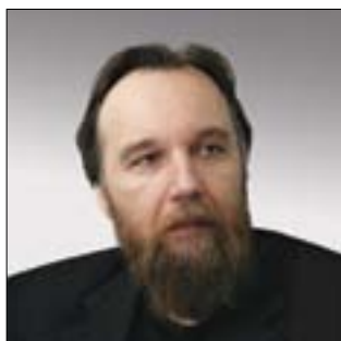
ПРЕДСЕДАТЕЛЬ ЕВРАЗИЙСКОГО КОМИТЕТА МЕЖДУНАРОДНОГО ОБЩЕСТВЕННОГО ДВИЖЕНИЯ «ЕВРАЗИЙСКОЕ ДВИЖЕНИЕ», ДИРЕКТОР ФОНДА «ЦЕНТР ГЕОПОЛИТИЧЕСКИХ ЭКСПЕРТИЗ» Александр Гельевич Дугин