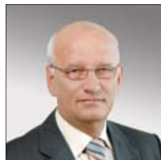
ГУБЕРНАТОР ОРЕНБУРГСКОЙ ОБЛАСТИ Юрий Александрович Берг