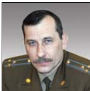
НАЧАЛЬНИК МЕТЕОЛОГИЧЕСКОЙ СЛУЖБЫ ВООРУЖЕННЫХ СИЛ РОССИЙСКОЙ ФЕДЕРАЦИИ, главный метеолог Игорь Викторович Лесун