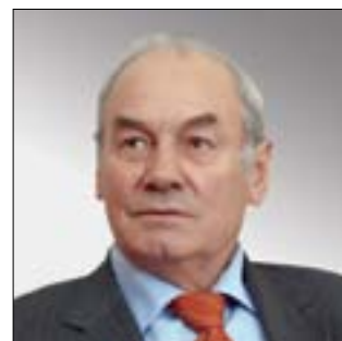
ПРЕЗИДЕНТ АКАДЕМИИ ГЕОПОЛИТИЧЕСКИХ ПРОБЛЕМ ГЕНЕРАЛ-ПОЛКОВНИК ПРОФЕССОР Леонид Григорьевич Ивашов