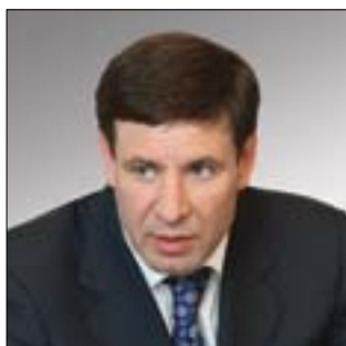
ГУБЕРНАТОР ЧЕЛЯБИНСКОЙ ОБЛАСТИ Михаил Валериевич Юревич