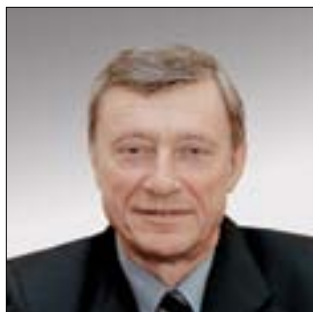
ГЕНЕРАЛЬНЫЙ СЕКРЕТАРЬ ОРГАНИЗАЦИИ ДОГОВОРА О КОЛЛЕКТИВНОЙ БЕЗОПАСНОСТИ Николай Николаевич Бордюжа