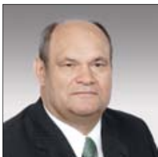
ГУБЕРНАТОР ПЕНЗЕНСКОЙ ОБЛАСТИ Василий Кузьмич Бочкарёв