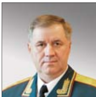
НАЧАЛЬНИК ГЛАВНОГО УПРАВЛЕНИЯ СВЯЗИ ВООРУЖЕННЫХ СИЛ РОССИЙСКОЙ ФЕДЕРАЦИИ – ЗАМЕСТИТЕЛЬ НАЧАЛЬНИКА ГЕНЕРАЛЬНОГО ШТАБА ВООРУЖЕННЫХ СИЛ РОССИЙСКОЙ ФЕДЕРАЦИИ ГЕНЕРАЛ-МАЙОР Вадим Аркадьевич Малюков