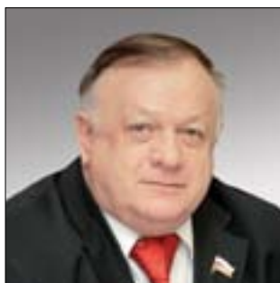
ПРЕДСЕДАТЕЛЬ КОМИТЕТА ГОСУДАРСТВЕННОЙ ДУМЫ ПО ОБОРОНЕ Виктор Михайлович Заварзин