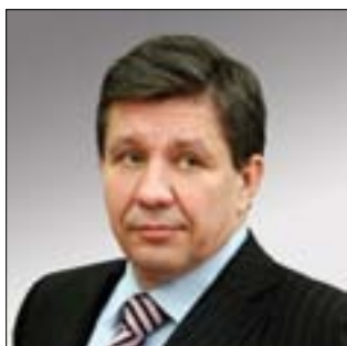
ПЕРВЫЙ ЗАМЕСТИТЕЛЬ МИНИСТРА ОБОРОНЫ РОССИЙСКОЙ ФЕДЕРАЦИИ Владимир Александрович Поповкин