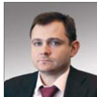
ДИРЕКТОР ДЕПАРТАМЕНТА АВИАЦИОННОЙ ПРОМЫШЛЕННОСТИ МИНПРОМТОРГА РОССИИ Юрий Борисович Слюсарь