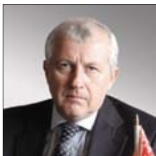
НАЧАЛЬНИК ДЕПАРТАМЕНТА ОБОРОННОЙ ПРОМЫШЛЕННОСТИ И ВОЕННО-ТЕХНИЧЕСКОГО СОТРУДНИЧЕСТВА ПОСТОЯННОГО КОМИТЕТА СОЮЗНОГО ГОСУДАРСТВА Александр Николаевич Корсаков