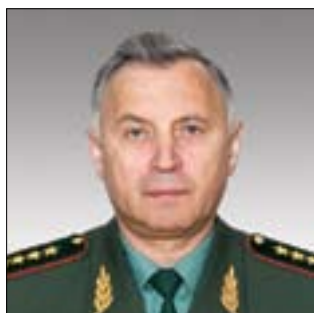
НАЧАЛЬНИК ГЕНЕРАЛЬНОГО ШТАБА ВООРУЖЕННЫХ СИЛ РФ – ПЕРВЫЙ ЗАМЕСТИТЕЛЬ МИНИСТРА ОБОРОНЫ РОССИЙСКОЙ ФЕДЕРАЦИИ ГЕНЕРАЛ АРМИИ Николай Егорович Макаров