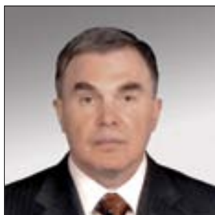
ДИРЕКТОР ДЕПАРТАМЕНТА МОБИЛИЗАЦИОННОЙ ПОДГОТОВКИ ЭКОНОМИКИ РФ И ФОРМИРОВАНИЯ ГОСУДАРСТВЕННОГО ОБОРОННОГО ЗАКАЗА ВОЕННО-ПРОМЫШЛЕННОЙ КОМИССИИ ПРИ ПРАВИТЕЛЬСТВЕ РФ Сергей Владимирович Хуторцев