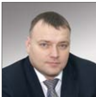
ДИРЕКТОР ДЕПАРТАМЕНТА РАДИОЭЛЕКТРОННОЙ ПРОМЫШЛЕННОСТИ МИНПРОМТОРГА РОССИИ Александр Сергеевич Якунин