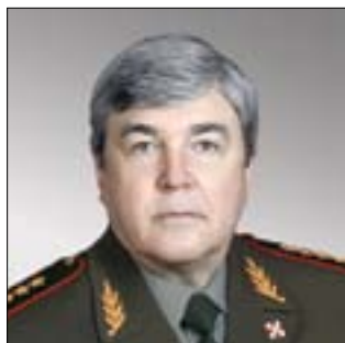
ЗАМЕСТИТЕЛЬ МИНИСТРА – ГЛАВНОКОМАНДУЮЩИЙ ВНУТРЕННИМИ ВОЙСКАМИ МВД РОССИИ ГЕНЕРАЛ АРМИИ Николай Евгеньевич Рогожкин