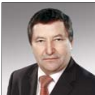
ГЛАВА АДМИНИСТРАЦИИ ТАМБОВСКОЙ ОБЛАСТИ Олег Иванович Бетин