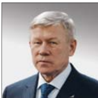
РУКОВОДИТЕЛЬ ФЕДЕРАЛЬНОГО КОСМИЧЕСКОГО АГЕНТСТВА Анатолий Николаевич Перминов