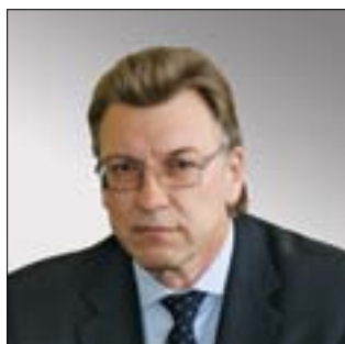
ДИРЕКТОР ДЕПАРТАМЕНТА РАЗВИТИЯ ОБОРОННО-ПРОМЫШЛЕННОГО КОМПЛЕКСА МИНПРОМТОРГА РОССИИ Сергей Иванович Довгучиц