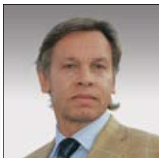
ДИРЕКТОР ИНСТИТУТА АКТУАЛЬНЫХ МЕЖДУНАРОДНЫХ ПРОБЛЕМ ДИПЛОМАТИЧЕСКОЙ АКАДЕМИИ МИНИСТЕРСТВА ИНОСТРАННЫХ ДЕЛ РОССИЙСКОЙ ФЕДЕРАЦИИ Алексей Константинович Пушков