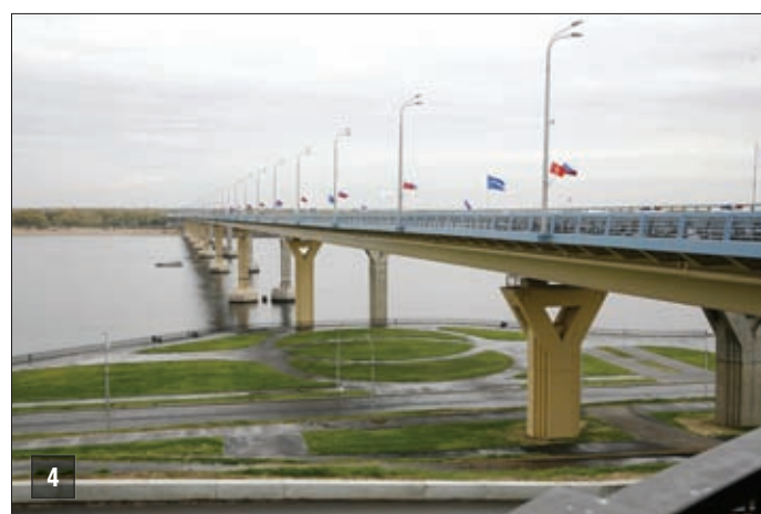
1–4. Волгоградский мост через Волгу

В прошлом году эта работа в области началась с министров, которые публично отчитывались за свою работу.