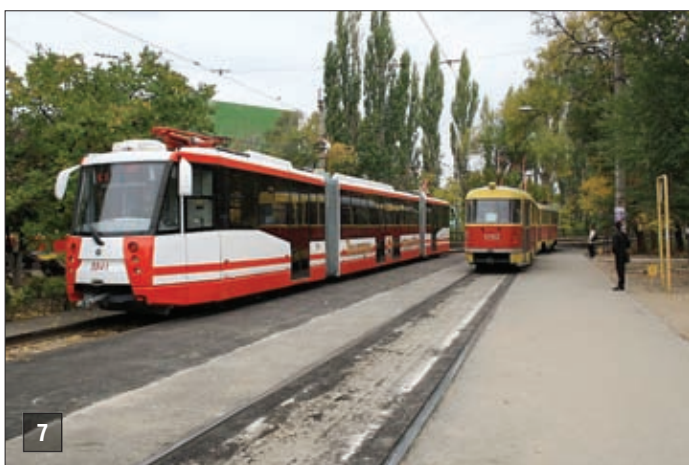
7-8. Волгоградский скоростной трамвай

Общественный транспорт Волгоградской области, осуществляющий социальные пассажирские перевозки по государственным регулируемым тарифам с предоставлением льгот по оплате проезда, включает 33 организации, имеющие 2395 единиц подвижного состава, и обслуживает 754 маршрута.