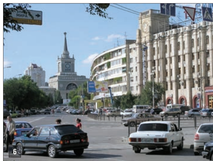
Вид на железнодорожный вокзал

вать как меру государственной поддержки при реализации инвестиционных проектов.