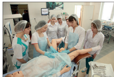
ЗАНЯТИЯ В ОБУЧАЮЩЕМ СИМУЛЯЦИОННОМ ЦЕНТРЕ ПО АКУШЕРСТВУ, ГИНЕКОЛОГИИ И ПЕРИНАТОЛОГИИ