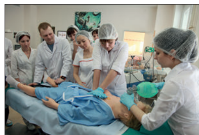
ОТРАБОТКА НАВЫКОВ ВЫПОЛНЕНИЯ ИСКУССТВЕННОГО ДЫХАНИЯ НА СИМУЛЯЦИОННОМ ТРЕНАЖЕРЕ-МАНЕКЕНЕ В УСЛОВИЯХ СТАЦИОНАРА

Участниками учебного процесса (на начало 2017/18 учебного года), включая Пятигорский филиал, являются 10 342 студента, 580 клинических ординаторов, 224 аспиранта, 6 докторантов. Всего в вузе обучаются 11 152 человека без учета курсантов факультета усовершенствования врачей (ФУВ) и студентов колледжа. На ФУВ ежегодно проходят подготовку и переподготовку, в том числе повышение квалификации, порядка 5 тыс. врачей. В медицинском колледже ВолгГМУ на сегодняшний день обучается почти 500 студентов. В таблице 1 представлены специальности и направления подготовки в вузе, формы и сроки обучения.