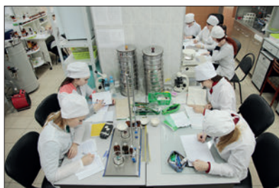
ЗАНЯТИЕ У СТУДЕНТОВ ВОЛГГМУ В ЦЕНТРЕ ПЕРВИЧНОЙ АККРЕДИТАЦИИ ФАРМАЦЕВТИЧЕСКОГО ФАКУЛЬТЕТА, В ЛАБОРАТОРИЯХ КОТОРОГО В ТЕЧЕНИЕ УЧЕБНОГО ГОДА ОТРАБАТЫВАЮТСЯ ПРАКТИЧЕСКИЕ НАВЫКИ