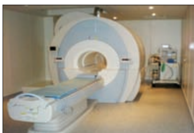
МАГНИТНО-РЕЗОНАНСНЫЙ КОМПЬЮТЕРНЫЙ ТОМОГРАФ