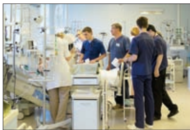
ОТДЕЛЕНИЕ ТРАВМАТОЛОГИИ И РЕАНИМАЦИИ