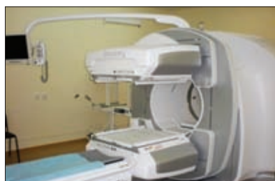
МУЛЬТИСПИРАЛЬНЫЙ РЕНТГЕНОВСКИЙ КОМПЬЮТЕРНЫЙ ТОМОГРАФ