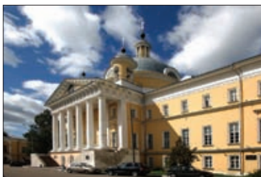
СВЯТО-ДМИТРИЕВСКОЕ УЧИЛИЩЕ СЕСТЕР МИЛОСЕРДИЯ