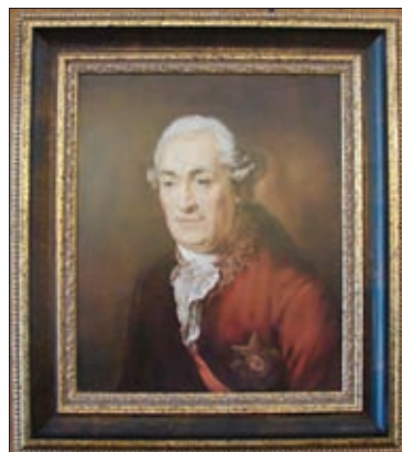
ДМИТРИЙ МИХАЙЛОВИЧ ГОЛИЦЫН (1721–1793)