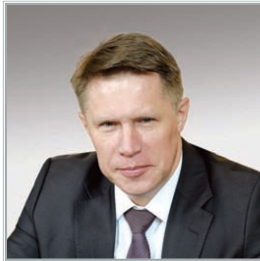
РУКОВОДИТЕЛЬ ФЕДЕРАЛЬНОЙ СЛУЖБЫ ПО НАДЗОРУ В СФЕРЕ ЗДРАВООХРАНЕНИЯ Михаил Альбертович Мурашко

Вопросы повышения эффективности выявления и профилактики нежелательных реакций лекарственных средств с 2008 года являются одним из приоритетных направлений деятельности Федеральной службы по надзору в сфере здравоохранения.