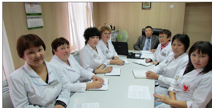
СОТРУДНИКИ АДМИНИСТРАЦИИ ЗАКАМЕНСКОЙ ЦРБ