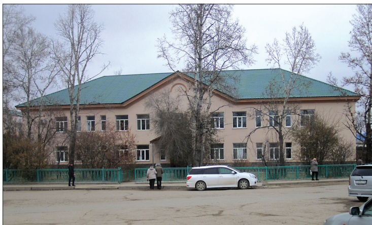
ЗДАНИЕ РАЙОННОЙ ПОЛИКЛИНИКИ