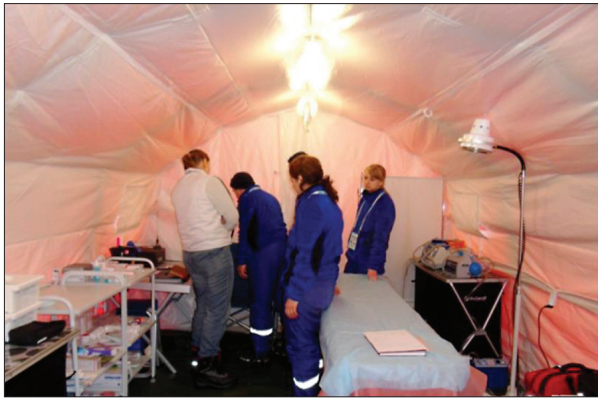
МЕДИЦИНСКИЕ ПУНКТЫ ОЛИМПИЙСКИХ СПОРТИВНЫХ ОБЪЕКТОВ