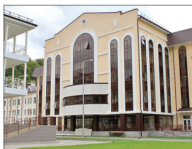
ИНФЕКЦИОННАЯ БОЛЬНИЦА №2, СОЧИ