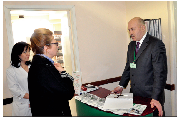
«ПОСТ КАЧЕСТВА» СМО

цам с ограниченными возможностями здоровья, пожилым людям, женщинам с малолетними детьми. В итоге количество невыданных полисов ОМС сократилось в два раза.