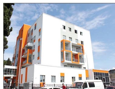
КРАЕВАЯ БОЛЬНИЦА №4, АДЛЕР

Под контролем Федерального фонда ОМС территориальный фонд проверял работу всех пунктов выдачи полисов ОМС страховых медицинских организаций, а также всех медицинских организаций Сочи.