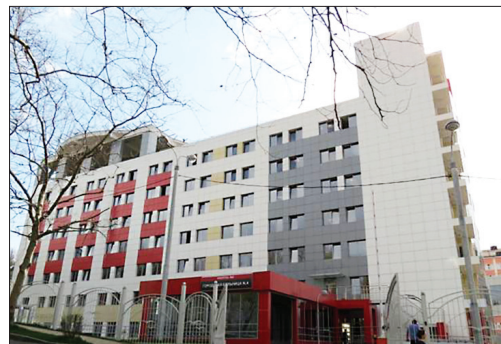
ГОРОДСКАЯ БОЛЬНИЦА №4, СОЧИ