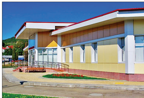
ГОРОДСКАЯ ПОЛИКЛИНИКА №2, СОЧИ