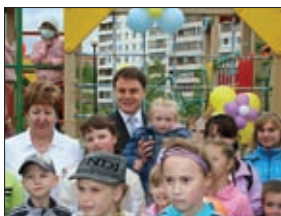
В ТУЛЬСКОЙ ОБЛАСТИ ФУНКЦИОНИРУЮТ 3 ЦЕНТРА ЗДОРОВЬЯ ДЛЯ ДЕТЕЙ