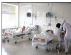
ТЕРРИТОРИАЛЬНЫЕ ПРОГРАММЫ РАЗВИТИЯ ЗДРАВООХРАНЕНИЯ ПРЕДУСМАТРИВАЮТ СОЦИАЛЬНУЮ ПОДДЕРЖКУ МОЛОДЫХ СПЕЦИАЛИСТОВ