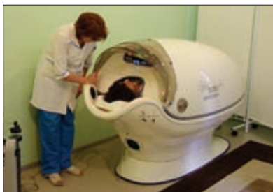
ДЛЯ ЛЕЧЕНИЯ РЯДА ЗАБОЛЕВАНИЙ В МЕДУЧРЕЖДЕНИЯХ ТУЛЬСКОЙ ОБЛАСТИ ИСПОЛЬЗУЮТ БАРОКАМЕРЫ