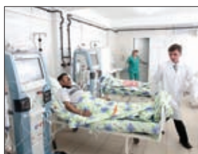
В ТУЛЬСКОЙ ОБЛАСТИ БОЛЬШОЕ ВНИМАНИЕ УДЕЛЯЕТСЯ УКРЕПЛЕНИЮ МАТЕРИАЛЬНО-ТЕХНИЧЕСКОЙ БАЗЫ УЧРЕЖДЕНИЙ ЗДРАВООХРАНЕНИЯ