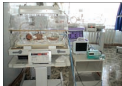
ИНКУБАТОР ДЛЯ НОВОРОЖДЕННЫХ ОБЕСПЕЧИВАЕТ БОЛЬНОМУ РЕБЕНКУ АДЕКВАТНЫЕ УСЛОВИЯ СРЕДЫ

кровообращения способствуют внедрение стандартов оказания медицинской помощи пациентам с острым коронарным синдромом, осуществление тромболитической терапии на догоспитальном этапе, увеличение объемов кардиохирургических методов лечения и доступности высокотехнологичного лечения в областных и федеральных медицинских организациях.