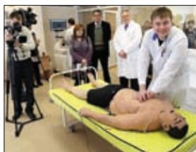
СИМУЛЯЦИОННОЕ ОБУЧЕНИЕ В ТУЛЬСКОЙ ОБЛАСТИ