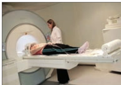
В МЕДИЦИНСКИХ УЧРЕЖДЕНИЯХ РЕГИОНА ИСПОЛЬЗУЮТСЯ РАЗЛИЧНЫЕ СОВРЕМЕННЫЕ МЕТОДЫ ДИАГНОСТИКИ