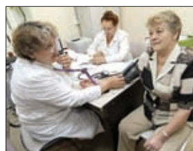
В РАБОТУ МЕДИЦИНСКИХ УЧРЕЖДЕНИЙ РЕГИОНА ВНЕДРЕНО 18 ФЕДЕРАЛЬНЫХ СТАНДАРТОВ ОКАЗАНИЯ МЕДИЦИНСКОЙ ПОМОЩИ ПРИ РАЗЛИЧНЫХ ЗАБОЛЕВАНИЯХ