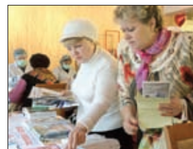
В РЕГИОНЕ ВОСТРЕБОВАНЫ ЦЕНТРЫ ЗДОРОВЬЯ ДЛЯ ВЗРОСЛОГО НАСЕЛЕНИЯ