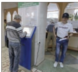
ВНЕДРЕНИЕ СИСТЕМЫ ЭЛЕКТРОННОЙ РЕГИСТРАТУРЫ В ЛЕЧЕБНЫХ УЧРЕЖДЕНИЯХ ТУЛЬСКОЙ ОБЛАСТИ