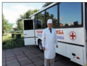
В РЕГИОНЕ ОРГАНИЗОВАНА ВЫЕЗДНАЯ РАБОТА ВРАЧЕБНЫХ БРИГАД