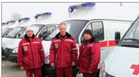
ВСЕ АВТОМОБИЛИ СКОРОЙ МЕДИЦИНСКОЙ ПОМОЩИ В ТУЛЬСКОЙ ОБЛАСТИ ОБОРУДОВАНЫ СРЕДСТВАМИ СПУТНИКОВОЙ НАВИГАЦИИ ГЛОНАСС