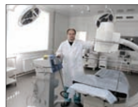
КАРДИОЛОГИЧЕСКИЙ ДИСПАНСЕР В ТУЛЕ ОСНАЩЕН ВСЕМ НЕОБХОДИМЫМ ОБОРУДОВАНИЕМ