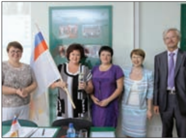
ОРГАНИЗАТОРЫ КОНКУРСОВ ПРОФМАСТЕРСТВА ФМБА РОССИИ