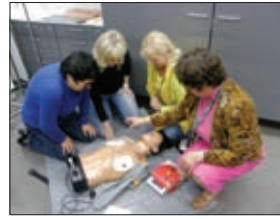
СТАЖИРОВКА В КЛИНИКЕ ФИНЛЯНДИИ