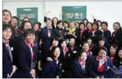
ПРИЕМ ИНОСТРАННОЙ ДЕЛЕГАЦИИ