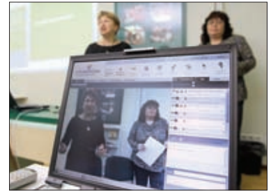
ВЕБИНАРЫ И ВИДЕОКОНФЕРЕНЦИИ

Официальный сайт nursing.edu.ru и издательские ресурсы открывают доступ к образовательным программам, новым руководствам, актуальным научным исследованиям, основанным на принципах доказательной медицины.