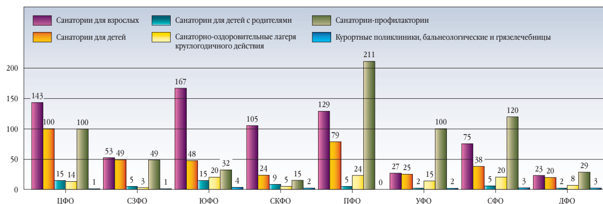
РАСПРЕДЕЛЕНИЕ САНАТОРНО-КУРОРТНЫХ ОРГАНИЗАЦИЙ РОССИЙСКОЙ ФЕДЕРАЦИИ ПО ФЕДЕРАЛЬНЫМ ОКРУГАМ В 2011 ГОДУ

656 санаториев-профилакториев, 16 курортных поликлиник, грязе- и бальнеологических лечебниц (рис. 2).