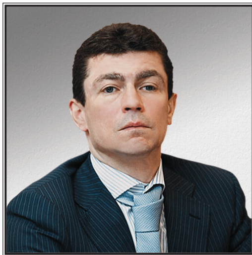
ЗАМЕСТИТЕЛЬ МИНИСТРА ЗДРАВООХРАНЕНИЯ И СОЦИАЛЬНОГО РАЗВИТИЯ РОССИЙСКОЙ ФЕДЕРАЦИИ Максим Анатольевич Топилин

В Министерстве здравоохранения и социального развития Российской Федерации смоделирован прогноз, посвященный ситуации на рынке труда России.