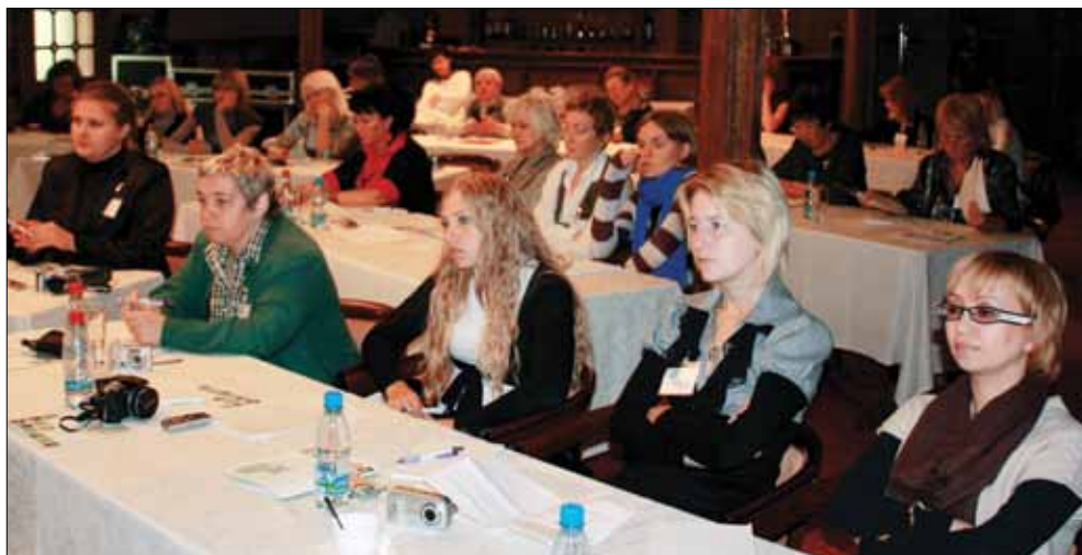
ЗАСЕДАНИЕ КЛУБА СОЦИАЛЬНОЙ ЖУРНАЛИСТИКИ

и публичности его деятельности. Посетители сайта в любой момент могут получить самую подробную информацию о Фонде, его программах, проводимых конкурсах. Ежедневно обновляемая лента новостей позволяет постоянно следить за тем, что происходит в Фонде.