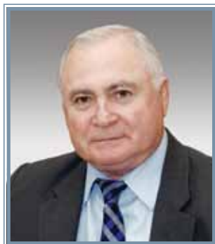
Рафаэль Гегамович Оганов

ГЛАВНЫЙ СПЕЦИАЛИСТ-ЭКСПЕРТ ГОСУДАРСТВЕННОГО НАУЧНО- ИССЛЕДОВАТЕЛЬНОГО ЦЕНТРА ПРОФИЛАКТИЧЕСКОЙ МЕДИЦИНЫ МИНЗДРАВСОЦРАЗВИТИЯ РОССИИ, ПРЕЗИДЕНТ ВСЕРОССИЙСКОГО НАУЧНОГО ОБЩЕСТВА КАРДИОЛОГОВ, АКАДЕМИК РАМН