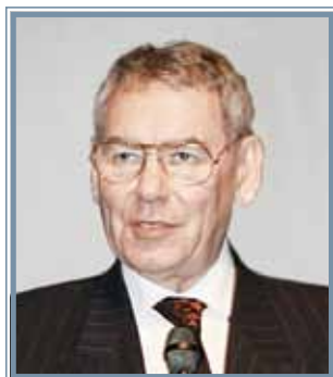
Леонид Борисович Лазебник

ДИРЕКТОР ФГБУ «НАУЧНЫЙ ЦЕНТР АКУШЕРСТВА, ГИНЕКОЛОГИИ И ПЕРИНАТОЛОГИИ ИМЕНИ АКАДЕМИКА В.И. КУЛАКОВА», АКАДЕМИК РАМН