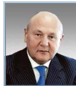
Геннадий Тихонович Сухих

ГЛАВНЫЙ СПЕЦИАЛИСТ-ЭКСПЕРТ ГОСУДАРСТВЕННОГО НАУЧНО- ИССЛЕДОВАТЕЛЬНОГО ЦЕНТРА ПРОФИЛАКТИЧЕСКОЙ МЕДИЦИНЫ МИНЗДРАВСОЦРАЗВИТИЯ РОССИИ, ПРЕЗИДЕНТ ВСЕРОССИЙСКОГО НАУЧНОГО ОБЩЕСТВА КАРДИОЛОГОВ, АКАДЕМИК РАМН