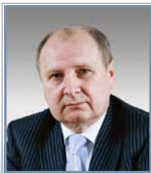
Владимир Григорьевич Шипков

ПРЕДСЕДАТЕЛЬ КОМИТЕТА ГОСУДАРСТВЕННОЙ ДУМЫ ПО НАУКЕ И НАУКОЕМКИМ ТЕХНОЛОГИЯМ, АКАДЕМИК РАН И РАМН