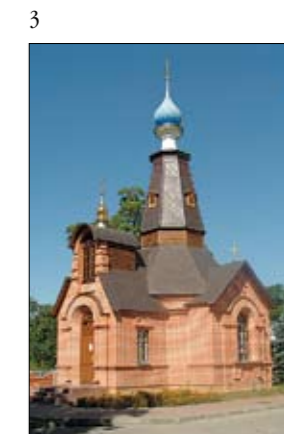
3 УНИВЕРСИТЕТСКАЯ ЦЕРКОВЬ

управлением образования, науки и молодежной политики. В настоящий момент реализуется 9 программ, ориентированных на педагогические кадры общего среднего и среднего профессионального образования Рязанского региона.