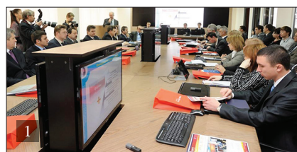
1. ЦЕНТРАЛЬНЫЙ ДИСПЕТЧЕРСКИЙ ПУНКТ УПРАВЛЕНИЯ В СИСТЕМЕ ГАЗОСНАБЖЕНИЯ