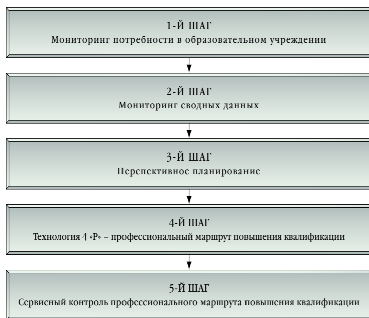
ДОРОЖНАЯ КАРТА ПОВЫШЕНИЯ КВАЛИФИКАЦИИ

рирует значительное увеличение слушателей за последний учебный год.