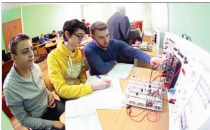
ЗАНЯТИЯ В ЛАБОРАТОРИИ