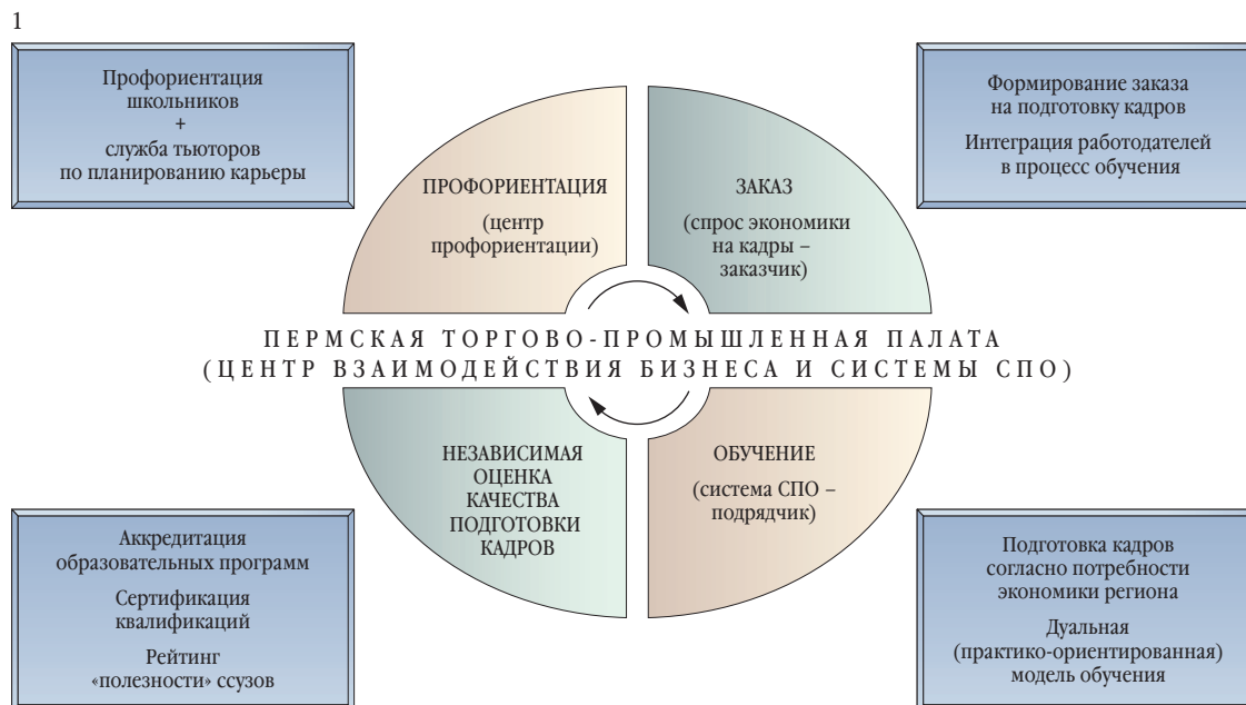
МОДЕЛЬ СИСТЕМЫ ПОДГОТОВКИ КАДРОВ ДЛЯ ЭКОНОМИКИ РЕГИОНА

ряда профильных российских министерств и бизнес-сообщества. Проект получил одобрение наблюдательного совета Агентства стратегических инициатив (АСИ) под председательством В.В. Путина, был рекомендован субъектам Федерации как лучшая региональная практика и стал платформой для участия Пермского края в реализации сразу двух федеральных инициатив – проекта АСИ «Подготовка рабочих кадров, соответствующих требованиям высокотехнологичных отраслей промышленности, на основе дуального образования» и программы Министерства образования и науки Российской Федерации «Подготовка рабочих кадров для социально-экономического развития регионов» на 2014–2019 годы.