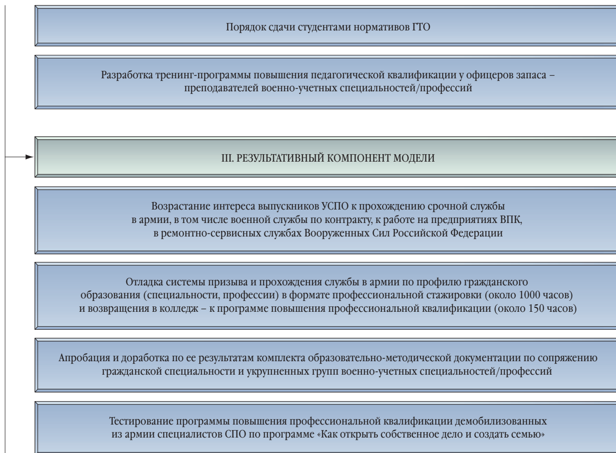
СТРУКТУРНО-СОДЕРЖАТЕЛЬНЫЕ КОМПОНЕНТЫ ОПОРНОГО РЦ В.У.С. СПО

– требования к результатам освоения военно-учетных специальностей, оптимизации их количества, так как каждая военно-учетная специальность подразумевает наличие преподавателей-специалистов и учебно-материальной и методической базы, из-за чего нужно создавать новые опор-