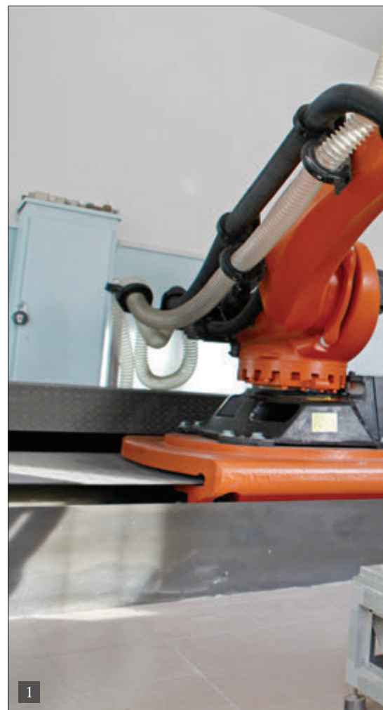
1. АСПИРАНТЫ ИРНТУ «НАУЧИЛИ» РОБОТОТЕХНИЧЕСКИЙ КОМПЛЕКС «КУКА» ОБРАБАТЫВАТЬ КРОМКИ КРУПНОГАБАРИТНЫХ ДЕТАЛЕЙ САМОЛЕТА. ПОДОБНЫЕ РАБОТЫ НЕ ВЕДУТСЯ НИ В ОДНОМ РОССИЙСКОМ ИНЖЕНЕРНОМ ВУЗЕ. РТК БУДЕТ ВНЕДРЕН В ТЕХНОЛОГИЧЕСКИЙ ПРОЦЕСС ИРКУТСКОГО АВИАЗАВОДА

История развития университета всегда определялась состоянием экономики региона и страны, тесными партнерскими взаимоотношениями с промышленными предприятиями и бизнесом, что способствует успешному движению вуза вперед. Современные условия выдвигают новые требования к университету как к системе, готовой эффективно реагировать на запросы экономики. В настоящее время Иркутская область находится в центре геополитических событий, определяющих ее будущее. Стартовала так называемая Восточная газовая программа, началось строительство газопровода «Сила Сибири», осваивается Ковыктинское месторождение, готовится к запуску новый самолет МС-21. Реализация гло-