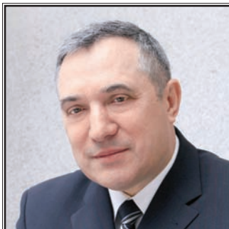
ПОЛНОМОЧНЫЙ ПРЕДСТАВИТЕЛЬ ПРЕЗИДЕНТА РОССИЙСКОЙ ФЕДЕРАЦИИ В СИБИРСКОМ ФЕДЕРАЛЬНОМ ОКРУГЕ Анатолий Васильевич Квашнин