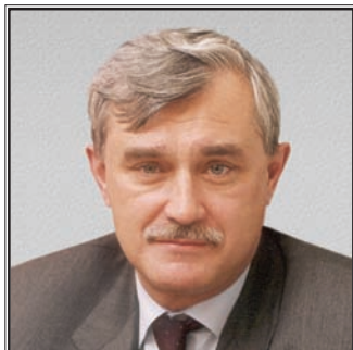
ПОЛНОМОЧНЫЙ ПРЕДСТАВИТЕЛЬ ПРЕЗИДЕНТА РОССИЙСКОЙ ФЕДЕРАЦИИ В ЦЕНТРАЛЬНОМ ФЕДЕРАЛЬНОМ ОКРУГЕ Георгий Сергеевич Полтавченко