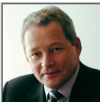
ЗАМЕСТИТЕЛЬ ПОЛНОМОЧНОГО ПРЕДСТАВИТЕЛЯ ПРЕЗИДЕНТА РОССИЙСКОЙ ФЕДЕРАЦИИ В УРАЛЬСКОМ ФЕДЕРАЛЬНОМ ОКРУГЕ Виктор Федорович Басаргин