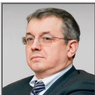
РЕКТОР ГОСУДАРСТВЕННОГО УНИВЕРСИТЕТА – ВЫСШЕЙ ШКОЛЫ ЭКОНОМИКИ Ярослав Иванович Кузьминов