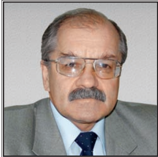
ЗАМЕСТИТЕЛЬ ГУБЕРНАТОРА НОВОСИБИРСКОЙ ОБЛАСТИ Геннадий Алексеевич Сапожников