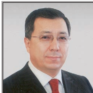
МИНИСТР ОБРАЗОВАНИЯ И НАУКИ РЕСПУБЛИКИ КАЗАХСТАН Жансеит Канситович Туймебаев