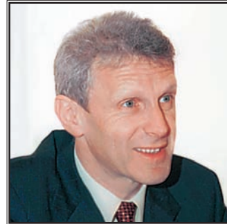
МИНИСТР ОБРАЗОВАНИЯ И НАУКИ РОССИЙСКОЙ ФЕДЕРАЦИИ Андрей Александрович Фурсенко