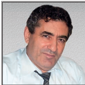
ЗАМЕСТИТЕЛЬ МИНИСТРА ОБРАЗОВАНИЯ И НАУКИ РОССИЙСКОЙ ФЕДЕРАЦИИ Исаак Иосифович Калина