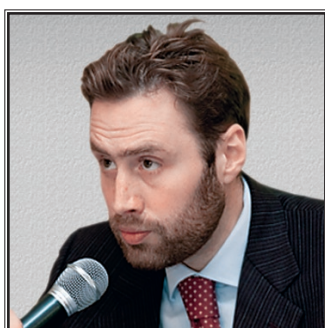
ПРЕДСЕДАТЕЛЬ ОБЩЕСТВЕННОГО СОВЕТА ЦЕНТРАЛЬНОГО ФЕДЕРАЛЬНОГО ОКРУГА Евгений Леонидович Юрьев