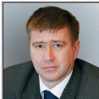
ПОЛНОМОЧНЫЙ ПРЕДСТАВИТЕЛЬ ПРЕЗИДЕНТА РОССИЙСКОЙ ФЕДЕРАЦИИ В ПРИВОЛЖСКОМ ФЕДЕРАЛЬНОМ ОКРУГЕ Александр Владимирович Коновалов