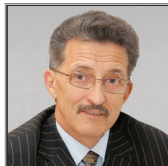
МИНИСТР ОБРАЗОВАНИЯ И НАУКИ РЕСПУБЛИКИ ТАТАРСТАН Наиль Мансурович Валеев