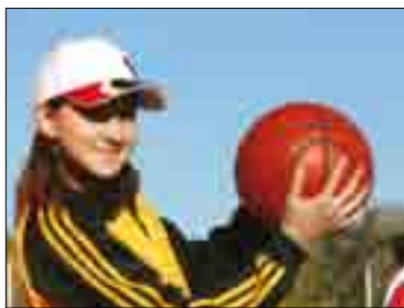
УЧАСТНИЦА ОКРУЖНОЙ СПАРТАКИАДЫ ДЛЯ ВОСПИТАННИКОВ ДЕТСКИХ ДОМОВ И ДОМОВ-ИНТЕРНАТОВ