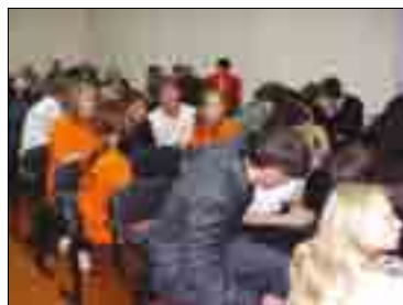
А ВОТ И ОТВЕТ! ОКРУЖНОЙ ФИНАЛ РАЗВИВАЮЩЕЙ ИГРЫ «ВЕЛИКОЛЕПНАЯ ПЯТЕРКА», Г. САРАНСК