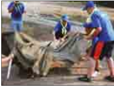
ОКРУЖНОЙ СКАУТСКИЙ ЛАГЕРЬ С УЧАСТИЕМ ДЕТЕЙ, ОСТАВШИХСЯ БЕЗ ПОПЕЧЕНИЯ РОДИТЕЛЕЙ. НИЖЕГОРОДСКАЯ ОБЛАСТЬ