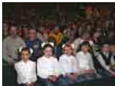
ВОСПИТАННИКИ ДЕТСКИХ ДОМОВ НА СПЕКТАКЛЕ В РАМКАХ РАЗВИВАЮЩЕЙ ПРОГРАММЫ «ТЮЗ – ДЕТСКИЙ ДОМ»