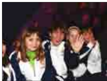
ФИНАЛ ОКРУЖНОЙ СПАРТАКИАДЫ ДЛЯ ВОСПИТАННИКОВ ДЕТСКИХ ДОМОВ И ДОМОВ-ИНТЕРНАТОВ