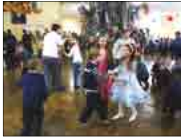
НОВОГОДНЯЯ ЁЛКА ПОЛНОМОЧНОГО ПРЕДСТАВИТЕЛЯ ПРЕЗИДЕНТА РФ В ПРИВОЛЖСКОМ ФЕДЕРАЛЬНОМ ОКРУГЕ