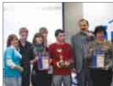
ВРУЧЕНИЕ НАГРАД ПОБЕДИТЕЛЯМ РАЗВИВАЮЩЕЙ ПРОГРАММЫ «ОКНО В ДЕТСТВО»

мью. Для этого необходимо преодолеть такое позорное явление, как социальное сиротство, помочь замещающим семьям, усовершенствовать деятельность попечительских советов, обеспечить защиту детей от насильственных посягательств, предоставить возможность свободного доступа к информационным ресурсам и современным средствам обучения, к правовой информации.