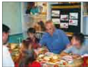
ПОЛНОМОЧНЫЙ ПРЕДСТАВИТЕЛЬ ПРЕЗИДЕНТА РФ В ПФО В ЛИБЕЖЕВСКОМ ДЕТСКОМ ДОМЕ

тернет-голосованием, участие приняли свыше 20 тыс. посетителей сайта «Вернуть детство». Дети из детских домов, ставших победителями и призерами, поступили в заочную школу программиста, где с ними начали занятия профессиональные специалисты.