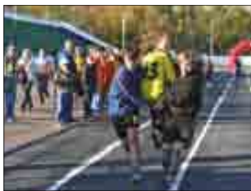
ФРАГМЕНТ ФИНАЛА ОКРУЖНОЙ СПАРТАКИАДЫ ДЛЯ ВОСПИТАННИКОВ ДЕТСКИХ ДОМОВ И ДОМОВ-ИНТЕРНАТОВ, Г. САЛАВАТ