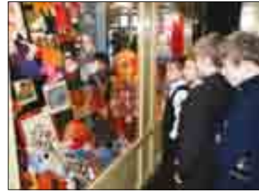
НА ВЫСТАВКЕ ДЕТСКИХ ПОДЕЛОК

ге, рабочие группы по реализации проекта во всех субъектах Федерации, расположенных в пределах округа. В состав рабочих групп вошли представители государственной власти, общественных организаций, бизнеса, науки и культуры. Рабочая группа при полномочном представителе и региональные рабочие группы осуществляют свою деятельность на основании полугодовых рабочих планов. Таким образом, создана управленческая сеть реализации проекта, охватывающая все регионы и направления деятельности.