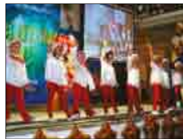
ФРАГМЕНТ ФИНАЛА ОКРУЖНОЙ ПРОГРАММЫ «ЗВЕЗДЫ ДЕТСТВА»

вали проведение Первого окружного форума добровольческих организаций Приволжского федерального округа, на котором обсуждались правовые аспекты их деятельности, реальная работа, которой будет обогащен проект «Вернуть детство».