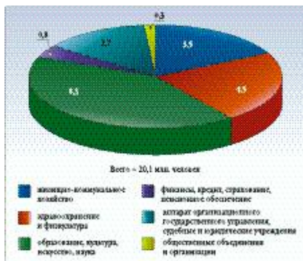
ЧИСЛЕННОСТЬ ЗАНЯТЫХ В НЕПРОИЗВОДСТВЕННОЙ СФЕРЕ В 2000 ГОДУ

курения между молодежью, вступающей в трудоспособный возраст, и высвобождаемыми работниками среднего и старшего возраста. Учитывая это, в перспективе по-прежнему главной задачей остается недопущение массовой безработицы, особенно в тех регионах, где она уже в настоящее время близка к критической отметке.