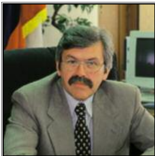
ПРЕДСЕДАТЕЛЬ ГОСУДАРСТВЕННОГО КОМИТЕТА РОССИЙСКОЙ ФЕДЕРАЦИИ ПО СТАТИСТИКЕ Владимир Леонидович Соколин

Всероссийская перепись населения – процесс сбора статистической информации, организованный по единой государственной статистической методологии на всей территории Российской Федерации для получения обобщенных демографических, экономических и социальных данных в отношении всех лиц, находящихся в стране в определенный момент времени. Такие переписи проводятся один раз в десять лет и являются основным источником сведений о населении страны.