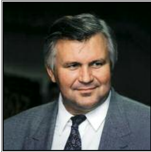
ПРЕЗИДЕНТ ТОРГОВО-ПРОМЫШЛЕННОЙ ПАЛАТЫ РОССИЙСКОЙ ФЕДЕРАЦИИ Станислав Алексеевич Смирнов