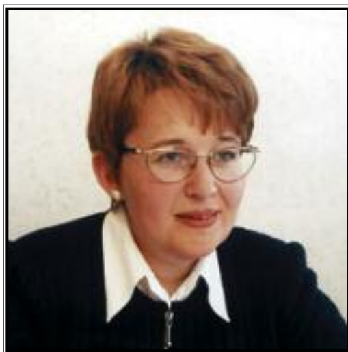
ЗАМЕСТИТЕЛЬ ПРЕДСЕДАТЕЛЯ КОМИТЕТА ПО БЮДЖЕТУ И НАЛОГАМ ГОСДУМЫ РФ Оксана Генриховна Дмитриева

Минувший год был годом исключительно благоприятной экономической конъюнктуры. Во-первых, имели место рекордно высокие темпы экономического роста – около 8% за год. Выпуск продукции и услуг базовых отраслей увеличился на 8%, а рост объемов промышленной продукции составил 9% (см. табл. 1).