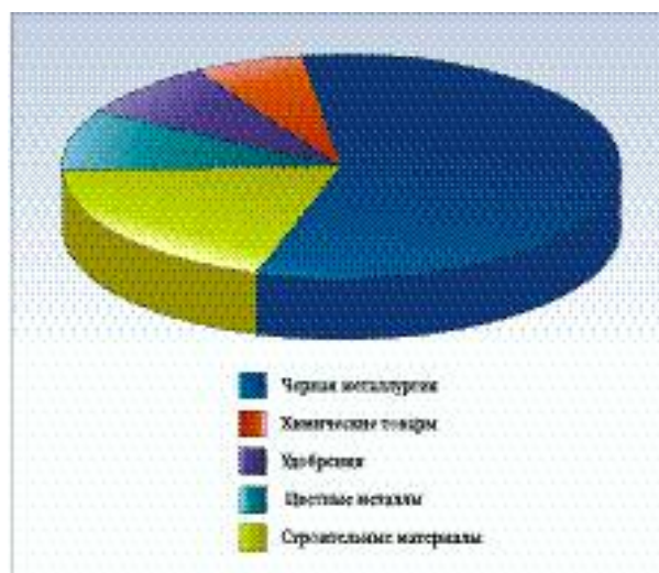
ПРИМЕНЕНИЕ ОГРАНИЧИТЕЛЬНЫХ МЕР В ПОТОВАРНОМ РАЗРЕЗЕ

ность получения российскими компаниями рыночного режима расследования. Запрос требует предоставления информации, необходимой для принятия решения, функционирует ли российская компания в рыночных условиях, а именно: