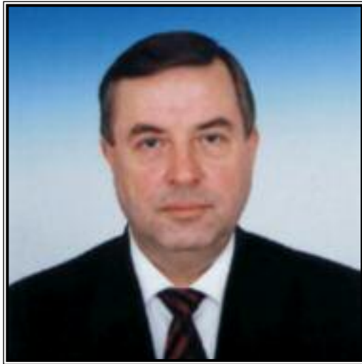
ПРЕДСЕДАТЕЛЬ ГОСУДАРСТВЕННОЙ ДУМЫ ФЕДЕРАЛЬНОГО СОБРАНИЯ РОССИЙСКОЙ ФЕДЕРАЦИИ Геннадий Николаевич Селезнев

После принятия на всенародном референдуме 12 декабря 1993 года Конституции Российской Федерации в нашей стране действует новая политическая система, в рамках которой осуществляет свою деятельность Государственная Дума Федерального Собрания Российской Федерации. На протяжении последних семи с половиной лет, наверное, не проходит и дня, в течение которого в средствах массовой информации так или иначе не упоминалась бы наша палата российского парламента. Мы ежедневно получаем десятки и сотни писем, телеграмм, обращений от граждан, органов государственной власти и местного самоуправления, самых различных общественных организаций. Учреждены должности постоянных представителей Президента Российской Федерации и Правительства Российской Федерации в Государственной Думе. Нескончаем поток наших соотечественников и иностранных граждан, посещающих Государственную Думу.