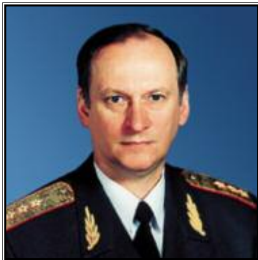
ДИРЕКТОР ФЕДЕРАЛЬНОЙ СЛУЖБЫ БЕЗОПАСНОСТИ РОССИЙСКОЙ ФЕДЕРАЦИИ Николай Платонович Патрушев

Привлечение в российскую экономику иностранного капитала, учитывая потребность нашей страны в капитальных вложениях на модернизацию морально и физически устаревших производственных фондов, разработку природных ресурсов и совершенствование структуры хозяйства, выгодно с точки зрения преодоления дефицита финансовых ресурсов, привлечения новых технологий, создания рабочих мест, освоения мировых рынков и т.д.