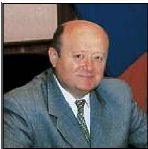
ДИРЕКТОР ФЕДЕРАЛЬНОЙ СЛУЖБЫ НАЛОГОВОЙ ПОЛИЦИИ РОССИЙСКОЙ ФЕДЕРАЦИИ Михаил Ефимович Фрадков

18 марта 2002 г. Федеральной службе налоговой полиции Российской Федерации исполнится 10 лет. Созданная как Главное управление налоговых расследований при Госналогслужбе, преобразованная затем в Департамент налоговой полиции и, наконец, в Федеральную службу налоговой полиции, она прочно заняла свое место в системе правоохранительных органов.