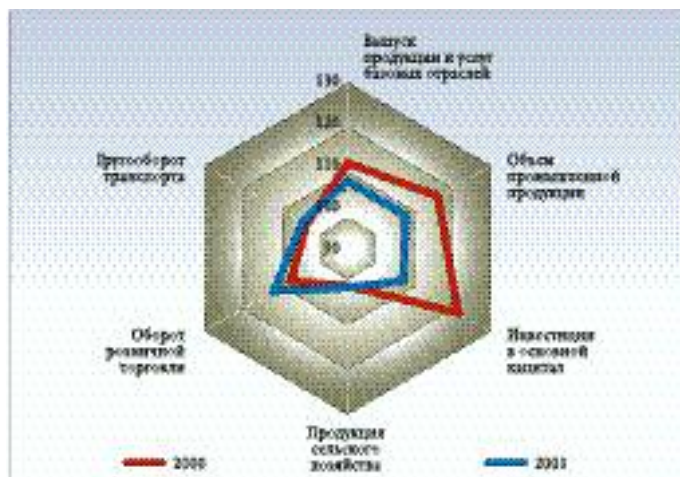
ИЗМЕНЕНИЕ ОСНОВНЫХ ПОКАЗАТЕЛЕЙ ПРОИЗВОДСТВА ТОВАРОВ И УСЛУГ В МАЕ 2000 И 2001 ГОДОВ (в % к маю предыдущего года)