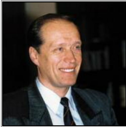
ПРЕДСЕДАТЕЛЬ ЦЕНТРАЛЬНОЙ ИЗБИРАТЕЛЬНОЙ КОМИССИИ РОССИЙСКОЙ ФЕДЕРАЦИИ Александр Альбертович Вешняков

«Федеральный справочник» регулярно публикует материалы, посвященные наиболее актуальным вопросам выборов и референдумов в Российской Федерации. Такое внимание к электоральной тематике вполне объяснимо. Демократические выборы являются важнейшей составляющей политической жизни современной России, определяя механизм формирования властных структур всех уровней и влияя практически на все сферы общества.