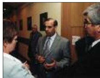
ПРЕДСТАВЛЕНИЕ НОВОГО ГЛАВЫ МИНИСТЕРСТВА ЭНЕРГЕТИКИ РОССИИ ИГОРЯ ЮСУФОВА (В ЦЕНТРЕ)

транспорта. Это вторая попытка подготовки необходимого документа. Речь идет о разделении возложенных на МПС функций государственного регулирования и хозяйственной деятельности, создании условий для развития конкуренции.