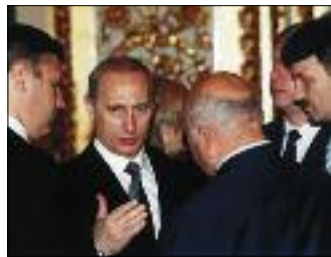
ТОРЖЕСТВЕННЫЙ ПРИЕМ В КРЕМЛЕ В ЧЕСТЬ ДНЯ РОССИИ. СЛЕВА НАПРАВО: М. КАСЬЯНОВ, В. ПУТИН, Ю. ЛУЖКОВ И Г. ГРЕФ

12 ФЕВРАЛЯ, ПОНЕДЕЛЬНИК Деньги, и только деньги