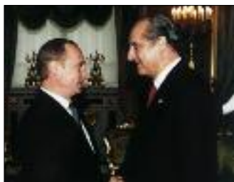
ПРЕЗИДЕНТ РОССИИ В. ПУТИН ВСТРЕТИЛСЯ С ПРЕЗИДЕНТОМ АВСТРИИ Т. КЛЕСТИЛЕМ