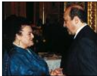
ТОРЖЕСТВЕННЫЙ ПРИЕМ В КРЕМЛЕ В ЧЕСТЬ ДНЯ РОССИИ. Л. ЗЫКИНА И И. ИВАНОВ ВО ВРЕМЯ ПРИЕМА

всего в общей технической деградации отрасли, и ее проблемы не решить административными методами. Госдума обсудила вопросы национальной политики