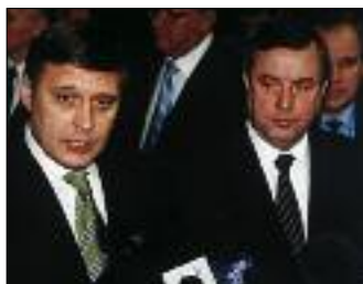
ПРЕМЬЕР-МИНИСТР РФ М. КАСЬЯНОВ ВСТРЕТИЛСЯ С РУКОВОДСТВОМ ГОСУДМУ, ПОСЛЕ ВСТРЕЧИ М. КАСЬЯНОВ И Г. СЕЛЕЗНЕВ ОТВЕТИЛИ НА ВОПРОСЫ ЖУРНАЛИСТОВ