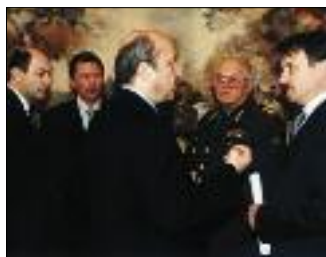
СЛЕВА НАПРАВО - В. РУШАЙЛО, С. ИВАНОВ, И. ИВАНОВ, И. СЕРГЕЕВ И Г. ГРЕФ ПЕРЕД НАЧАЛОМ СОВЕЩАНИЯ В КРЕМЛЕ

датель не упадет ниже 23 долларов за баррель, что почти на треть выше заложенной суммы в российский бюджет.