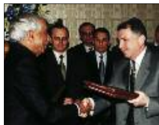
ПОДПИСАНИЕ ИТОГОВОГО ПРОТОКОЛА ПЕРВОГО ЗАСЕДАНИЯ РОССИЙСКО-ИНДИЙСКОЙ МЕЖПРАВИТЕЛЬСТВЕННОЙ КОМИССИИ ПО ВОЕННО-ТЕХНИЧЕСКОМУ СОТРУДНИЧЕСТВУ