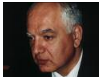
СПЕЦПРЕДСТАВИТЕЛЬ ПРЕЗИДЕНТА РОССИИ ПО ОБЕСПЕЧЕНИЮ ПРАВ И СВОБОД ЧЕЛОВЕКА И ГРАЖДАНИНА В ЧЕЧНЕ В. КАЛАМАНОВ