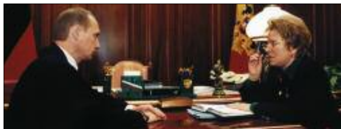
ВСТРЕЧА ПРЕЗИДЕНТА РФ В. ПУТИНА И ВИЦЕ-ПРЕМЬЕРА В. МАТВИЕНКО