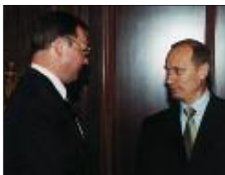
ПРЕЗИДЕНТ РОССИИ В. ПУТИН ПРИНЯЛ 4 ЯНВАРЯ 2001 ГОДА В КРЕМЛЕ ПРЕДСЕДАТЕЛЯ СЧЕТНОЙ ПАЛАТЫ С. СТЕПАШИНА