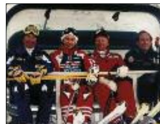
В. ПУТИН НА ФУНИКУЛЕРЕ ВО ВРЕМЯ ПРЕБЫВАНИЯ ВО ВСЕМИРНО ИЗВЕСТНОМ ЦЕНТРЕ ГОРНО-ЛЫЖНОГО СПОРТА В АВСТРИИ