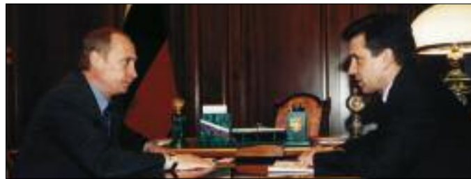
ВСТРЕЧА ПРЕЗИДЕНТА РФ В. ПУТИНА И ГЛАВЫ ПЕНСИОННОГО ФОНДА М. КАСЬЯНОВА

РФ Виктор Христенко. По его мнению, необходим новый этап развития системы межбюджетных отношений – основы экономического федерализма. Только реальные налоговобюджетные полномочия региональных и местных властей могут обеспечить их реальную ответственность за положение дел на местах и заинтересованность в проведении экономических и бюджетных реформ.