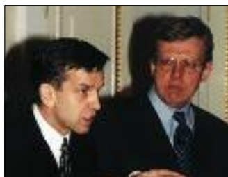
М. ЗУРАБОВ (СЛЕВА) И А. КУДРИН НА СОВЕЩАНИИ В КРЕМЛЕ ПО РЕФОРМИРОВАНИЮ ПЕНСИОННОЙ СИСТЕМЫ