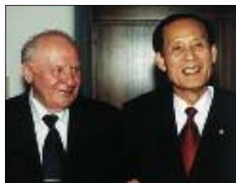
ВСТРЕЧА ПРЕДСЕДАТЕЛЯ СОВЕТА ФЕДЕРАЦИИ РФ ЕГОРА СТРОЕВА И СПИКЕРА НАЦИОНАЛЬНОЙ АССАМБЛЕИ РЕСПУБЛИКИ КОРЕЯ ЛИ МАН СОБА