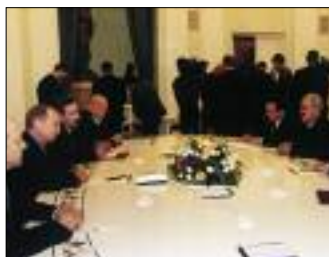
ПЕРЕГОВОРЫ ПРЕЗИДЕНТА РОССИИ В. ПУТИНА С ВИЦЕ-ПРЕЗИДЕНТОМ ИРАКА ТАХИЙ ЯСИНОМ РАМАДАНОМ