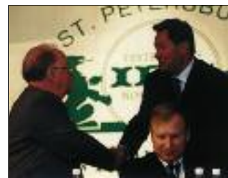
НА ЮБИЛЕЙНОМ ДЕСЯТОМ МЕЖДУНАРОДНОМ БАНКОВСКОМ КОНГРЕССЕ В САНКТ-ПЕТЕРБУРГЕ

металл приблизится вплотную к отметке десять долларов за один грамм.