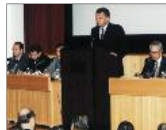
ЗАМЕСТИТЕЛЬ ПРЕДСЕДАТЕЛЯ ПРАВИТЕЛЬСТВА РФ В. ХРИСТЕНКО ВЫСТУПАЕТ ПЕРЕД ДЕЛЕГАЦИЕЙ ЯПОНСКОЙ ДЕЛОВОЙ ЭЛИТЫ

мической элиты. Главная тема дискуссии – как обеспечить экономический рост в мире и преодолеть расширяющуюся пропасть между бедными и богатыми. Кроме того, на форуме обсуждалось развитие телекоммуникационных мировых систем и совершенствование информационного обмена в этой области между странами. Проведено около 300 семинаров и пленарных заседаний. 30 января форум завершил свою работу.