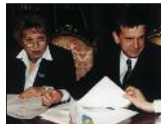
В. МАТВИЕНКО, М. ЗУРБАКОВ НА СОВЕЩАНИИ В КРЕМЛЕ ПО ПЕНСИОННОЙ РЕФОРМЕ

«использования схемы обмена обязательств РФ на требования к другим странам, а также обмена долга СССР на инвестиции в российскую экономику и на финансовые активы развивающихся стран – должников России по Парижскому клубу». Дума считает целесообразным «законодательно ограничить в будущем размер общих выплат из федерального бюджета по обслуживанию государственно-го внешнего долга РФ в пределах до 12 млрд. долларов в год».