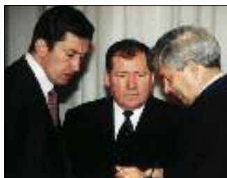
СЛЕВА НАПРАВО: А. ПОЧИНОК, Г. БУКАЕВ И Ф. ГАЗИЗУЛЛИН НА ОЧЕРЕДНОМ ЗАСЕДАНИИ ПРАВИТЕЛЬСТВА ПО ИТОГАМ ПРИВАТИЗАЦИИ В РФ