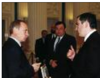
ПРЕЗИДЕНТ РОССИИ В. ПУТИН ВСТРЕТИЛСЯ С ЧЛЕНАМИ РОССИЙСКОГО СОЮЗА ПРОМЫШЛЕННИКОВ И ПРЕДПРИНИМАТЕЛЕЙ. ПРЕЗИДЕНТ БЕСЕДУЕТ С ПРЕДСЕДАТЕЛЕМ ПРАВЛЕНИЯ ОАО «ЮКОС» М. ХОДОРКОВСКИМ