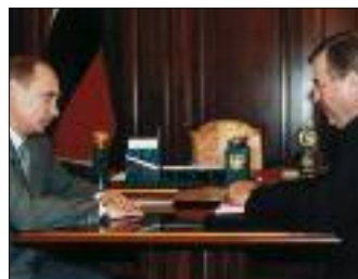
ПРЕЗИДЕНТ РФ В. ПУТИН ВСТРЕТИЛСЯ СО СПИКЕРОМ ГОСУДУМЫ РФ Г. СЕЛУЗНЕВЫМ