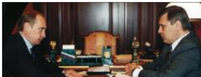
В КРЕМЛЕ СОСТОЯЛАСЬ ВСТРЕЧА ПРЕЗИДЕНТА РФ В. ПУТИНА И ПРЕДСЕДАТЕЛЯ ПРАВИТЕЛЬСТВА РФ М. КАСЬЯНОВА, КОТОРЫЙ ВОЗВРАТИЛСЯ ИЗ РАБОЧЕЙ ПОЕЗДКИ НА ДАЛЬНИЙ ВОСТОК