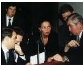
ОБСУЖДЕНИЕ ЗЕМЕЛЬНОГО КОДЕКСА НА ВНЕОЧЕРЕДНОМ ПЛЕНАРНОМ ЗАСЕДАНИИ ГОСДУМЫ

В 2001 году компенсацию смогут получить граждане, родившиеся не позднее 1928 года.