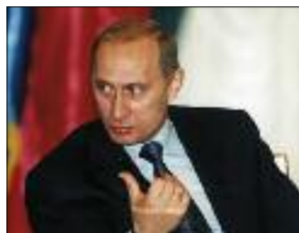
В. ПУТИН НА ВСТРЕЧЕ С ЧЛЕНАМИ РОССИЙСКОГО СОЮЗА ПРОМЫШЛЕННИКОВ И ПРЕДПРИНИМАТЕЛЕЙ