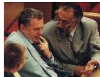
СЛЕВА НАПРАВО: И. ЛЕБЕДЕВ, В. ЖИРИНОВСКИЙ И А. ЧИЛИНГАРОВ НА ЗАСЕДАНИИ ГОСУДМУ

банка. При этом глава делегации отметил новое качество нашего участия: «Мы теперь не берем кредитов, мы их возвращаем...»