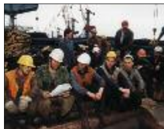
ДОКЕРЫ ПРИМОРЬЯ ПРОТЕСТУЮТ ПРОТИВ НОВОГО ПРОЕКТА ТРУДОВОГО КОДЕКСА, КОТОРЫЙ РАССМАТРИВАЕТСЯ СОГЛАСИТЕЛЬНОЙ КОМИССИЕЙ ГОСДУМЫ РФ

сии пакетов 30 крупнейших предприятий Киргизии, в основном военно-промышленного комплекса.