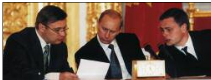
ЗАСЕДАНИЕ ГОСУДАРСТВЕННОГО СОВЕТА РФ

дителями крупнейших западных компаний. В итоговом документе участники дискуссии резюмировали, что инвестиционный климат в нашей стране улучшается.