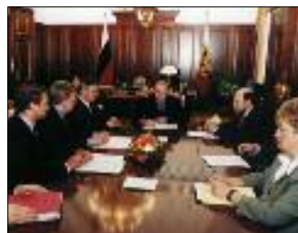
СОВЕЩАНИЕ В КРЕМЛЕ ПО ЭКОНОМИЧЕСКИМ ВОПРОСАМ