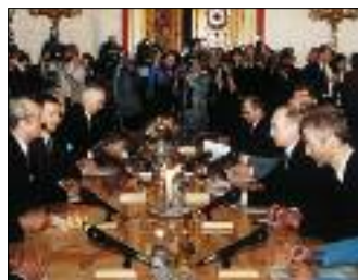
РОССИЙСКО-АВСТРИЙСКИЕ ПЕРЕГОВОРЫ В КРЕМЛЕ