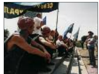
ПРЕДСТАВИТЕЛИ НЕЗАВИСИМОГО ПРОФСОЮЗА ГОРНЯКОВ РФ ПРОВОДЯТ БЕССРОЧНОЕ ПИКЕТИРОВАНИЕ У ДОМА ПРАВИТЕЛЬСТВА