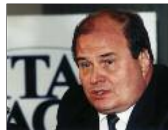
В ИТАР-ТАСС СОСТОЯЛАСЬ ВСТРЕЧА С ЖУРНАЛИСТАМИ ПРЕДСЕДАТЕЛЯ ПРАВИТЕЛЬСТВА ЧЕЧЕНСКОЙ РЕСПУБЛИКИ С. ИЛЬЯСОВА

реработку зарубежного облученного ядерного топлива (ОЯТ).