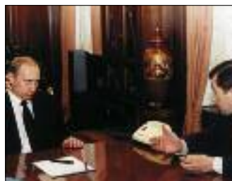
ВО ВРЕМЯ ВСТРЕЧИ В КРЕМЛЕ ПРЕЗИДЕНТА РОССИИ В. ПУТИНА И МИНИСТРА ТРУДА И СОЦИАЛЬНОГО РАЗВИТИЯ РФ А. ПОЧИНКА