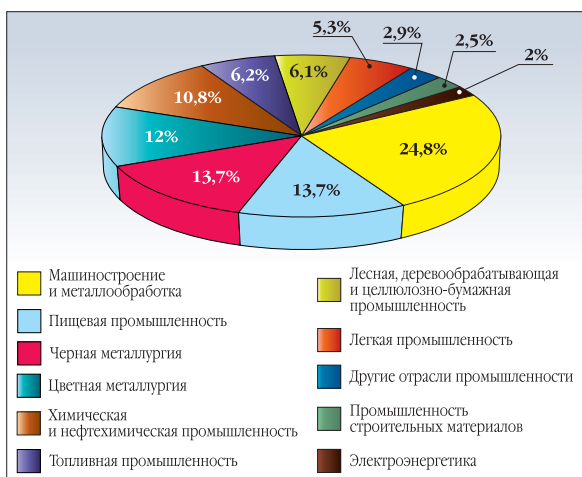
ТЕМПЫ РОСТА ПРОИЗВОДСТВА ПРОДУКЦИИ

ция замещает ранее импортируемую. Впервые в стране на Караваевской бумажной фабрике внедрен процесс изготовления упаковочной бумаги из 100 процентов макулатуры.