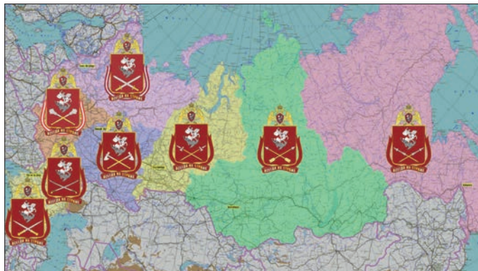
ОКРУГА ВОЙСК НАЦИОНАЛЬНОЙ ГВАРДИИ