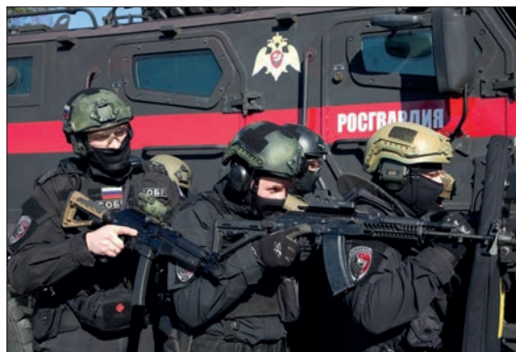
СОТРУДНИКИ СПЕЦПОДРАЗДЕЛЕНИЙ РОСГВАРДИИ