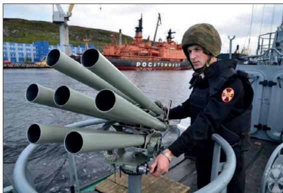
ВЫПОЛНЕНИЕ ЗАДАЧ МОРСКИМИ ВОЙСКИМИ ЧАСТЯМИ

Важным этапом в развитии войск национальной гвардии Российской Федерации явилось издание Федерального закона от 3 июля 2016 года №226-ФЗ «О войсках национальной гвардии Российской Федерации», которым определены роль и место войск в системе обеспечения национальной безопасности Российской Федерации.