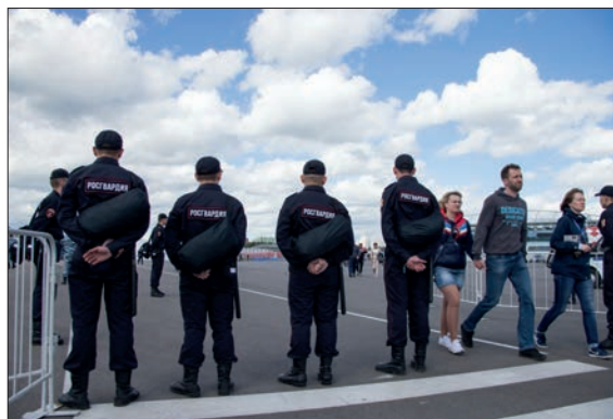
ОХРАНА ОБЩЕСТВЕННОГО ПОРЯДКА ПРИ ПРОВЕДЕНИИ МАССОВЫХ МЕРОПРИЯТИЙ

государственного контроля за топливно-энергетическим комплексом страны, в сфере оборота оружия и частной охранной деятельностью). Кроме того, также возможно совместное применение войсковых и полицейских сегментов ведомства (участие в борьбе с терроризмом и экстремизмом, оказание содействия пограничным органам в охране государственной границы, поддержание режима чрезвычайного положения).