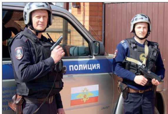
СОТРУДНИКИ ВНЕВЕДОМСТВЕННОЙ ОХРАНЫ