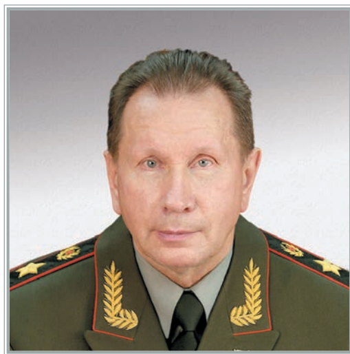
ДИРЕКТОР ФЕДЕРАЛЬНОЙ СЛУЖБЫ ВОЙСК НАЦИОНАЛЬНОЙ ГВАРДИИ РОССИЙСКОЙ ФЕДЕРАЦИИ – ГЛАВНОКОМАНДУЮЩИЙ ВОЙСКАМИ НАЦИОНАЛЬНОЙ ГВАРДИИ РОССИЙСКОЙ ФЕДЕРАЦИИ ГЕНЕРАЛ АРМИИ Виктор Васильевич Золотов

Новые угрозы национальной безопасности Российской Федерации (усиление политического давления на международной арене, экономические санкции, расширение масштабов информационной войны, поддержка из-за рубежа оппозиционных, сепаратистских и террористических сил, а также другие согласованные и масштабные действия, применяемые государствами Запада и направленные на расшатывание внутривнутриполитической обстановки в Российской Федерации), особенно ярко проявившиеся с начала 2014 года, предопределили необходимость пересмотра подходов к оптимизации системы обеспечения национальной безопасности Российской Федерации.