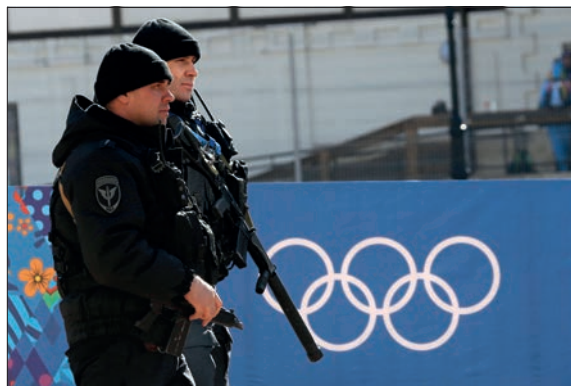
ВЫПОЛНЕНИЕ ЗАДАЧ ПО ОБЕСПЕЧЕНИЮ БЕЗОПАСНОСТИ XX ЗИМНИХ ОЛИМПИЙСКИХ ИГР В СОЧИ