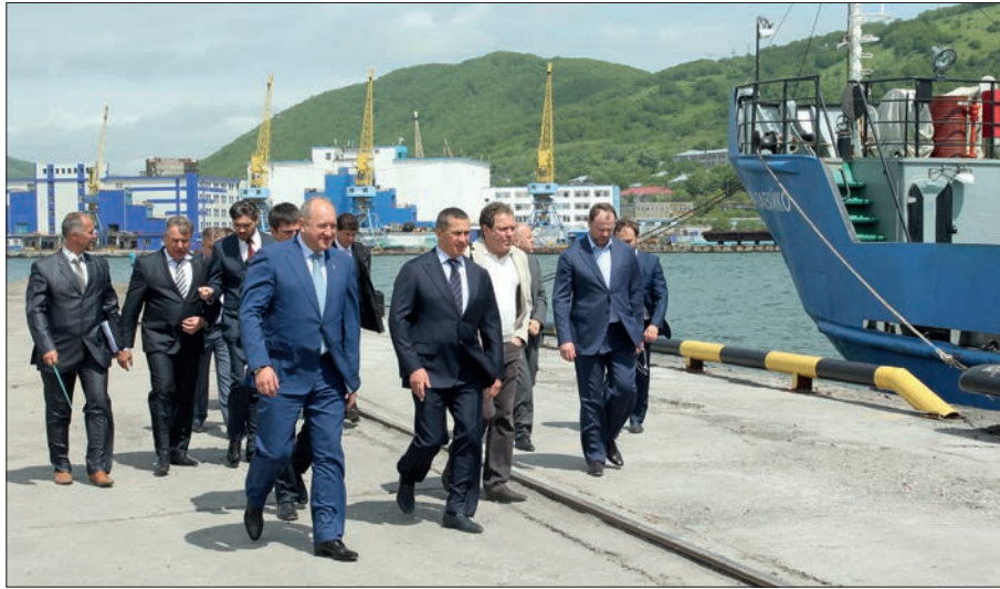
ПОЛНОМОЧНЫЙ ПРЕДСТАВИТЕЛЬ ПРЕЗИДЕНТА РОССИЙСКОЙ ФЕДЕРАЦИИ В ДАЛЬНЕВОСТОЧНОМ ФЕДЕРАЛЬНОМ ОКРУГЕ Ю.А. ТРУТНЕВ В ПЕТРОПАВЛОВСКОМ ПОРТУ

рыбы в страны АТР и Европу. Сейчас всю продукцию наши рыбопромышленные компании отправляют через приморские порты. Особенно в сезон лососевой путины это вызывает огромное количество трудностей. Не хватает холодильных мощностей, разгрузки приходится ждать по несколько суток, а дальше – проблемы с подвижным составом. Проект ООО «Терминал «Сероглазка» предполагает создание крупного морского рефрижераторного терминала на восточном побережье Камчатки, который даст прямой доступ к мировым товарным рынкам для камчатских производителей рыбной продукции. Кстати, недавно компания совместно со своим партнером Maersk Line, лидером в области морских контейнерных перевозок в мире, уже осуществила первый тестовый судозаход напрямую из Петропавловска-Камчатского в корейский порт Пусан, минуя порт Владивостока. В дальнейшем такие рейсы станут регулярными и наши рыбаки смогут избежать тех трудностей, с которыми они сталкиваются сегодня при перевалке грузов в Приморье.