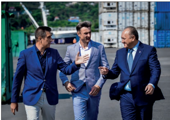
«СЕРОГЛАЗКА», МОРСКОЙ ЛОГИСТИЧЕСКИЙ ЦЕНТР