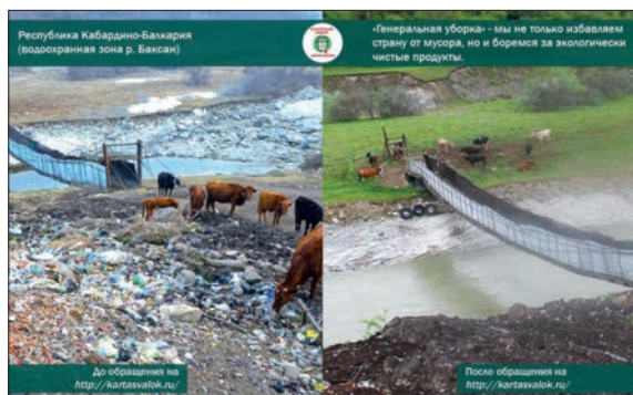
КАБАРДИНО-БАЛКАРСКАЯ РЕСПУБЛИКА. ФОТО АКТИВИСТОВ ОНФ