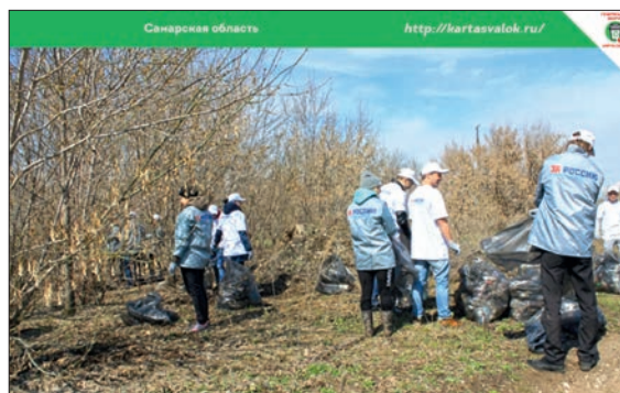
САМАРСКАЯ ОБЛАСТЬ. ФОТО АКТИВИСТОВ ОНФ

ми была проанализирована значительная часть принятых территориальных схем (в 72 субъектах). В большинстве из них присутствуют недочеты и несоответствия, более того, схемы не отражают реального количества отходов. Также до сих пор отсутствуют межрегиональные территориальные схемы, что актуально для таких регионов, как Москва и Московская область, Санкт-Петербург и Ленинградская область, Республика Крым и Севастополь, Краснодарский край и Республика Адыгея, регионов Байкальской природной территории (Иркутская область, Забайкальский край, Республика Бурятия). По этой проблеме эксперты проекта ОНФ «Генеральная уборка» обращались к Президенту Российской Федерации на медиафоруме ОНФ «Правда и справедливость» в апреле 2017 года, после чего Владимир Владимирович Путин дал правительству поручение подготовить предложения о совершенствовании законодательства Российской Федерации в части, касающейся разработки и утверждения межрегиональных схем в области обращения с отходами в границах особо охраняемых природных территорий. Срок исполнения – 1 сентября 2017 года. Но, к сожалению, инструменты для создания