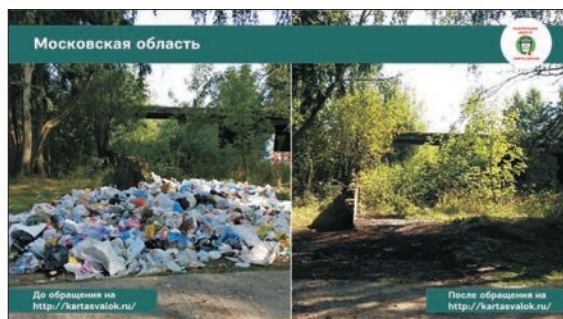
МОСКОВСКАЯ ОБЛАСТЬ.