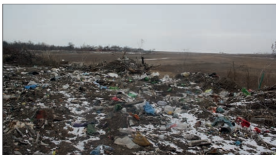
РОСТОВСКАЯ ОБЛАСТЬ, АЗОВСКИЙ РАЙОН.