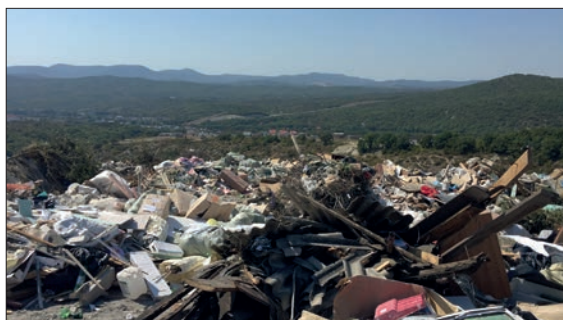
КРАСНОДАРСКИЙ КРАЙ.